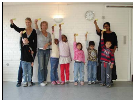
Ill.: 3 Børnegruppe og pædagoger fra Børnehuset Nord prøver kræfter med nogle gamle lege, før de kan erhverve deres kulturkørekort som en del af forløbet: Sans for kulturhistorie.