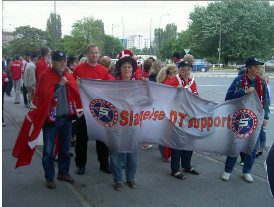
Ill.: 4 Slagelse Dream Team har en stor gruppe af trofaste supportere, der følger holdet både på hjemme- og udebane. For mange er medlemskabet af Dream Team Support et vigtigt socialt holdepunkt i tilværelsen, og for spillerne betyder det meget at have supporterne med som den 8. spiller på banen.

Undersøgelsen af Slagelse Dream Team er et udtryk for, at ikke kun fortiden men også nutiden spiller en vigtig rolle for et kulturhistorisk museums arbejde med at registrere, forske i, formidle og bevare kulturarven.