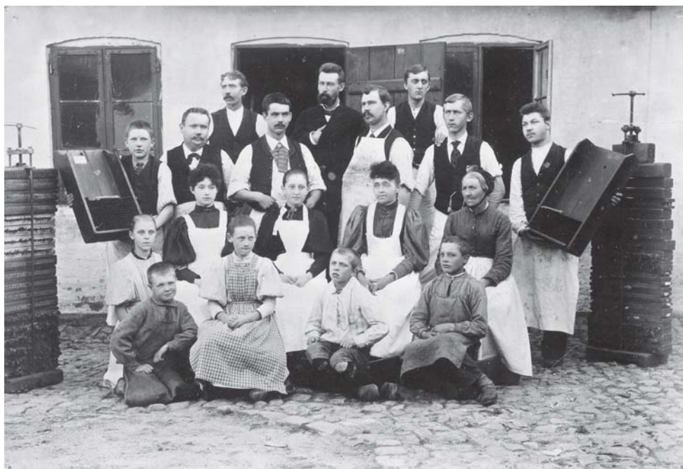
Ill.: 5 Cigar- og Tobaksfirmaet Vilhelm Lange blev oprettet i 1873 på Nytorv i Slagelse. Fabrikken blev indrettet i et mindre baghus og blev senere udvidet med Roys Tobaksfabrik. I 1934 blev virksomheden omdannet til et aktieselskab, og i 1966 opkøbte Skandinavisk Tobakskompagni tobaksfabrikken, og produktionen ophørte i Slagelse.