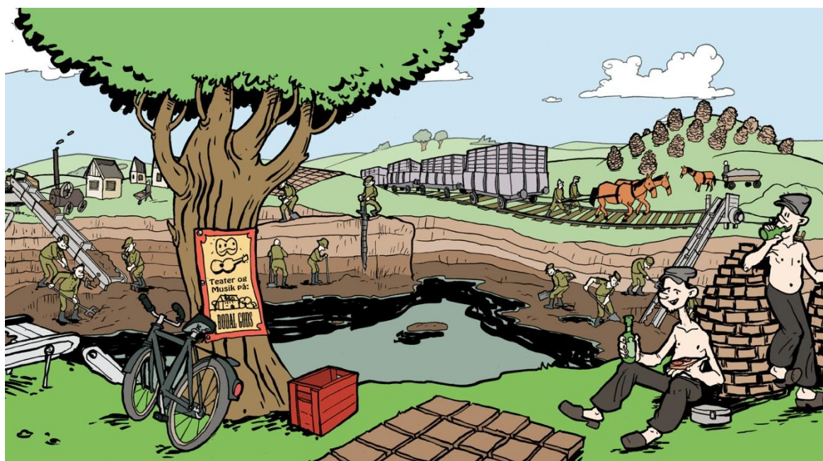
Figur 5 Tørvegravning i Åmosen. Illustration Erik Petri © Sydvestsjælland Museum.

Samtidig med den digitale ressource udvikles et fysisk undervisningsforløb, som skal finde sted på skolerne, hvor en museumsformidler aktiverer materialet. Der udbydes også et lærerkursus, som ruster lærerne til arbejdet med den digitale ressource på egen hånd, f.eks. som forberedelse til besøg af museumsformidleren. Forløbet understøtter folkeskolens arbejde med Fælles Mål samt enkelte punkter i historiefagets kanon.