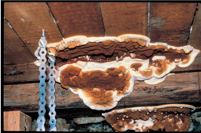
Figur 3 Ægte hussvamp

Ægte Hussvamp ( Serpula lacrymans ) forårsager de mest omfattende og alvorlige skader i bygninger. Dette skyldes bl.a., at den kan opstå og udbredes ved lavere træfugtighed end alle andre bygningsvampe.