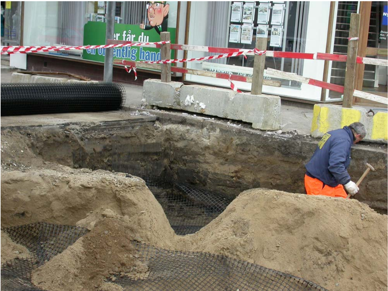
2004005D106: Der udskiftes jord ved Løvegades udmunding

Da jeg ankom var man stort set færdig med afgravningen og udlagde "geo-net" i Løvegades begyndelse. Der var ingen fund at samle ind, og det opgravede så meget omlejret og omrodet ud. Arbejderne havde dog opsamlet en lille hornstøjle fra ko i dette område, som blev medtaget.