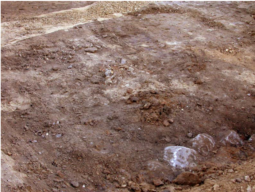
2004005D113: Omgravet kulturjord fra 1600-tallet i den østlige del af Løvegade.

Overvågning af afgravning i krydset Løvegade – Rosengade gav en 1000-1100 tals brønd samt nyere tids kulturlag, der var stærkt omrodet.