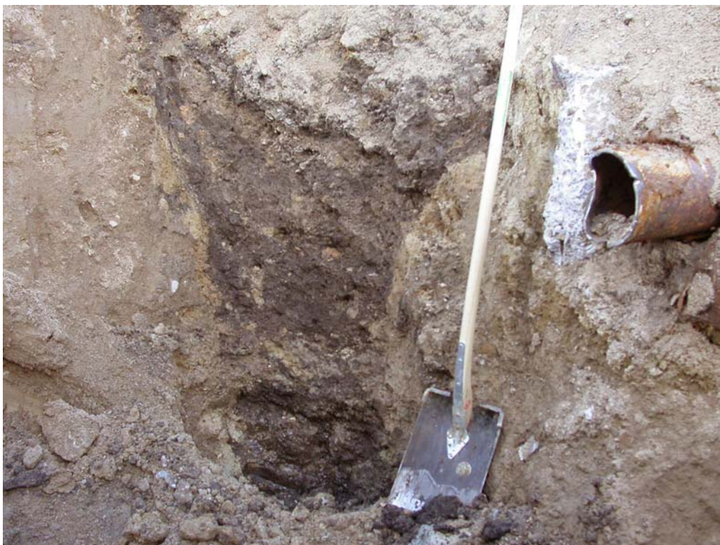
2004005D112: Snit gennem brønd A73