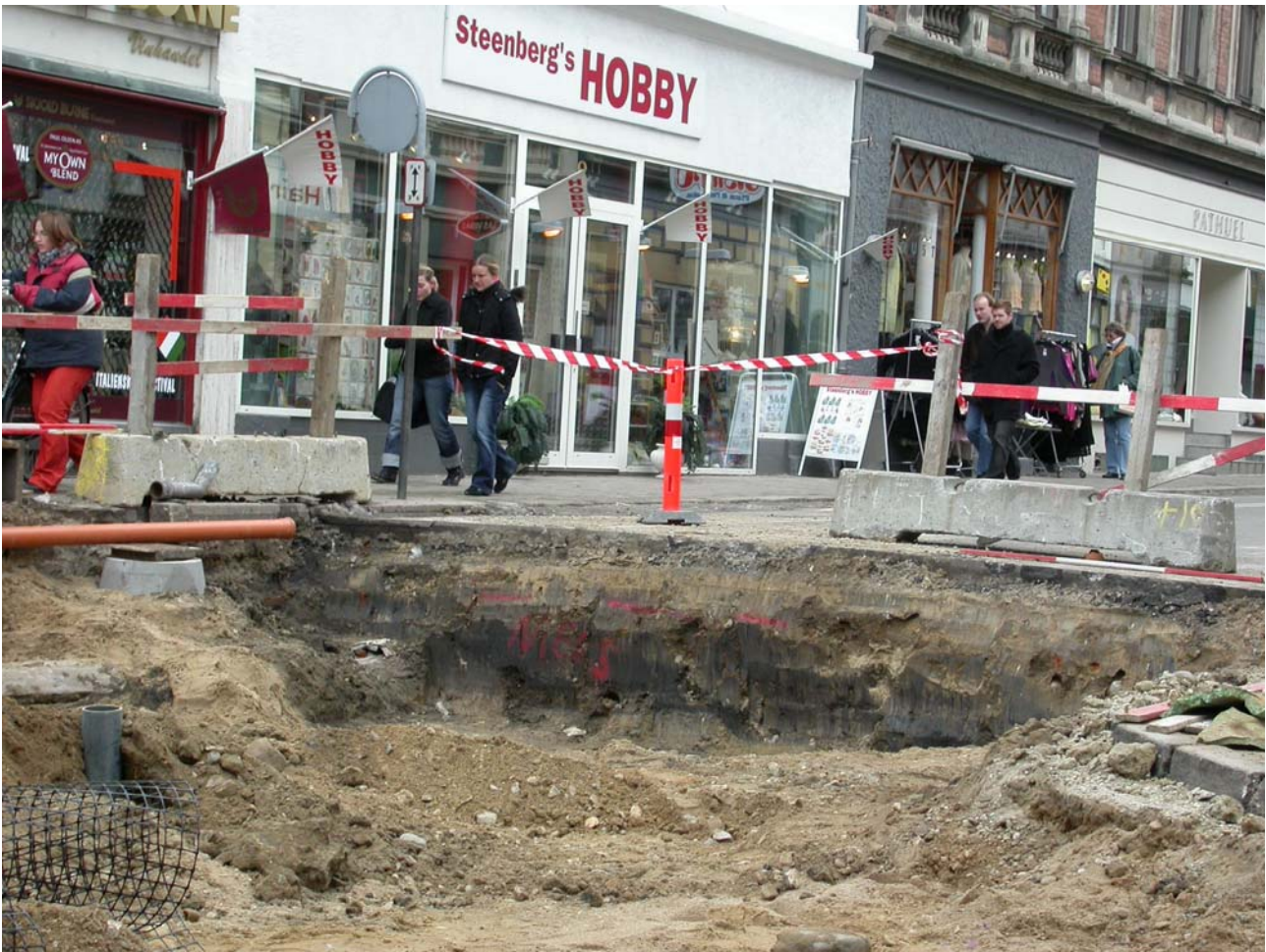
2004005D107: Afgravningen ved Rosengades udmunding i pladsen