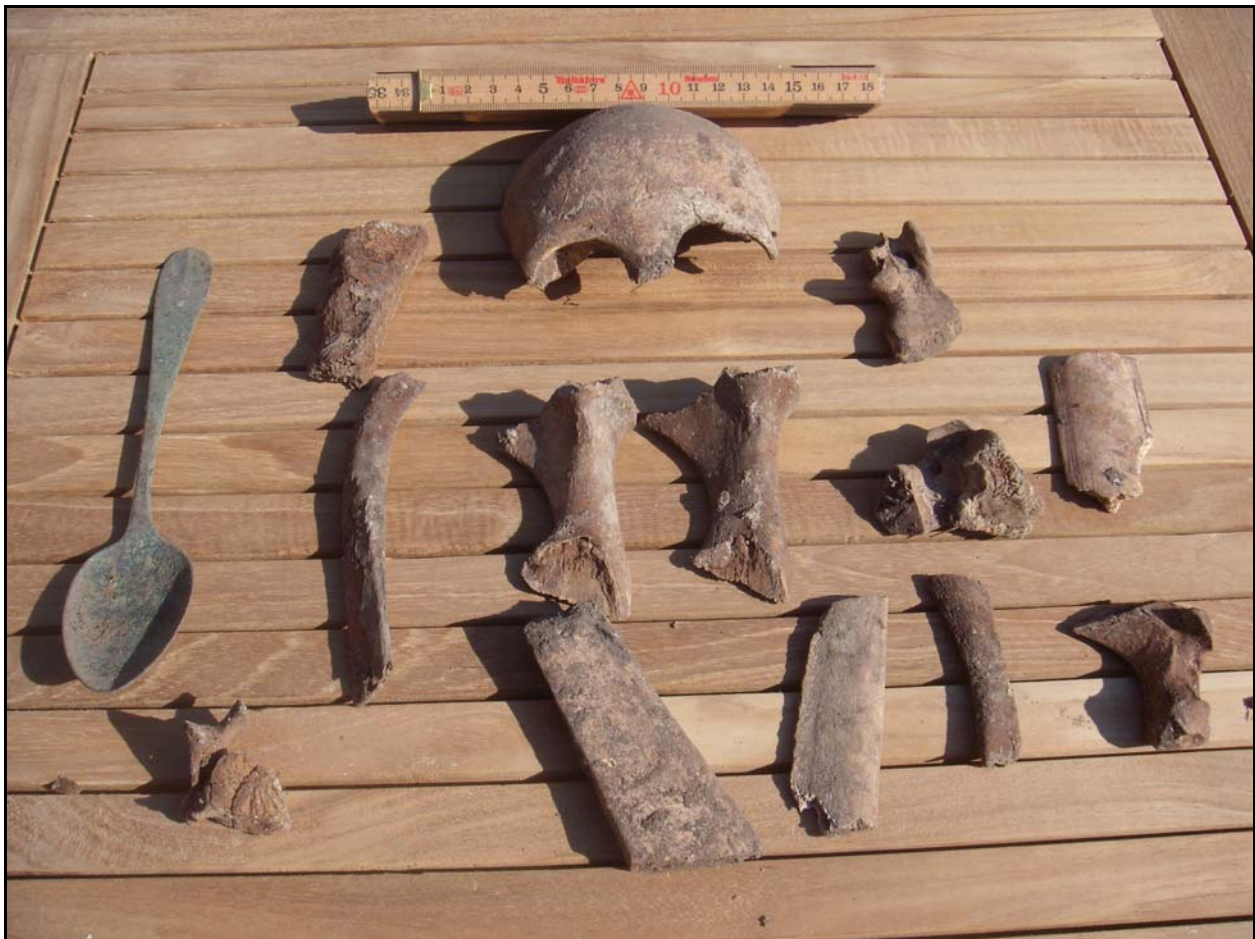
Registreringsfoto af det til museet indbragte materiale.