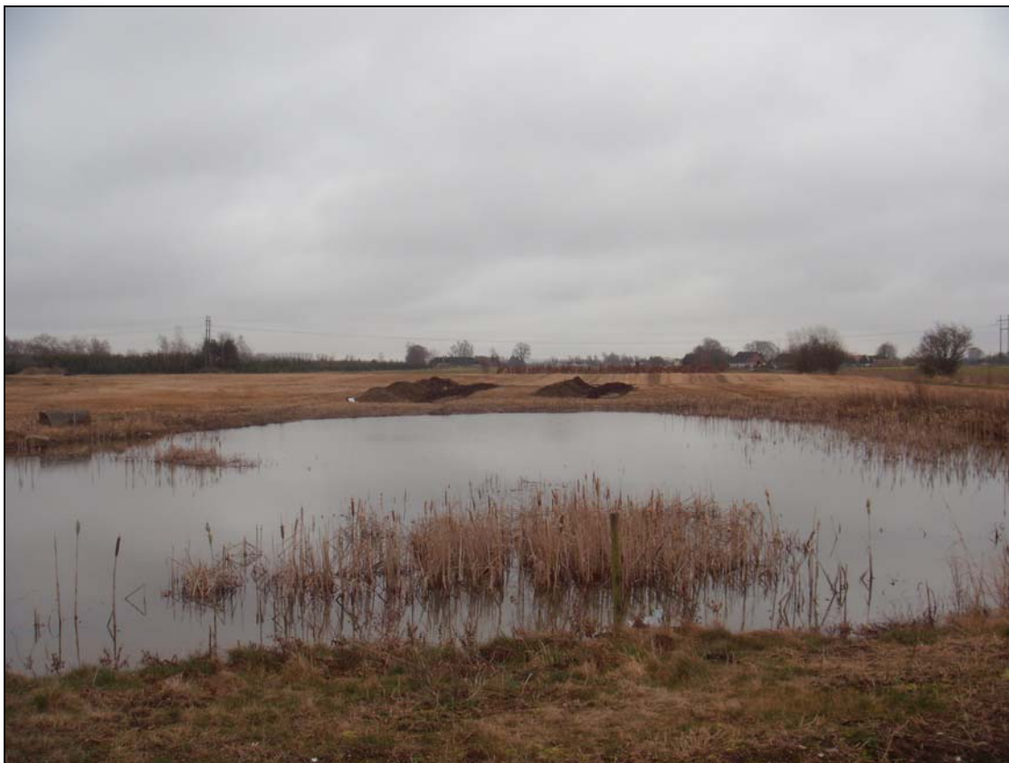
Foto 01267D01. De to søgegrøfter ved den eksisterende sø set fra vest.