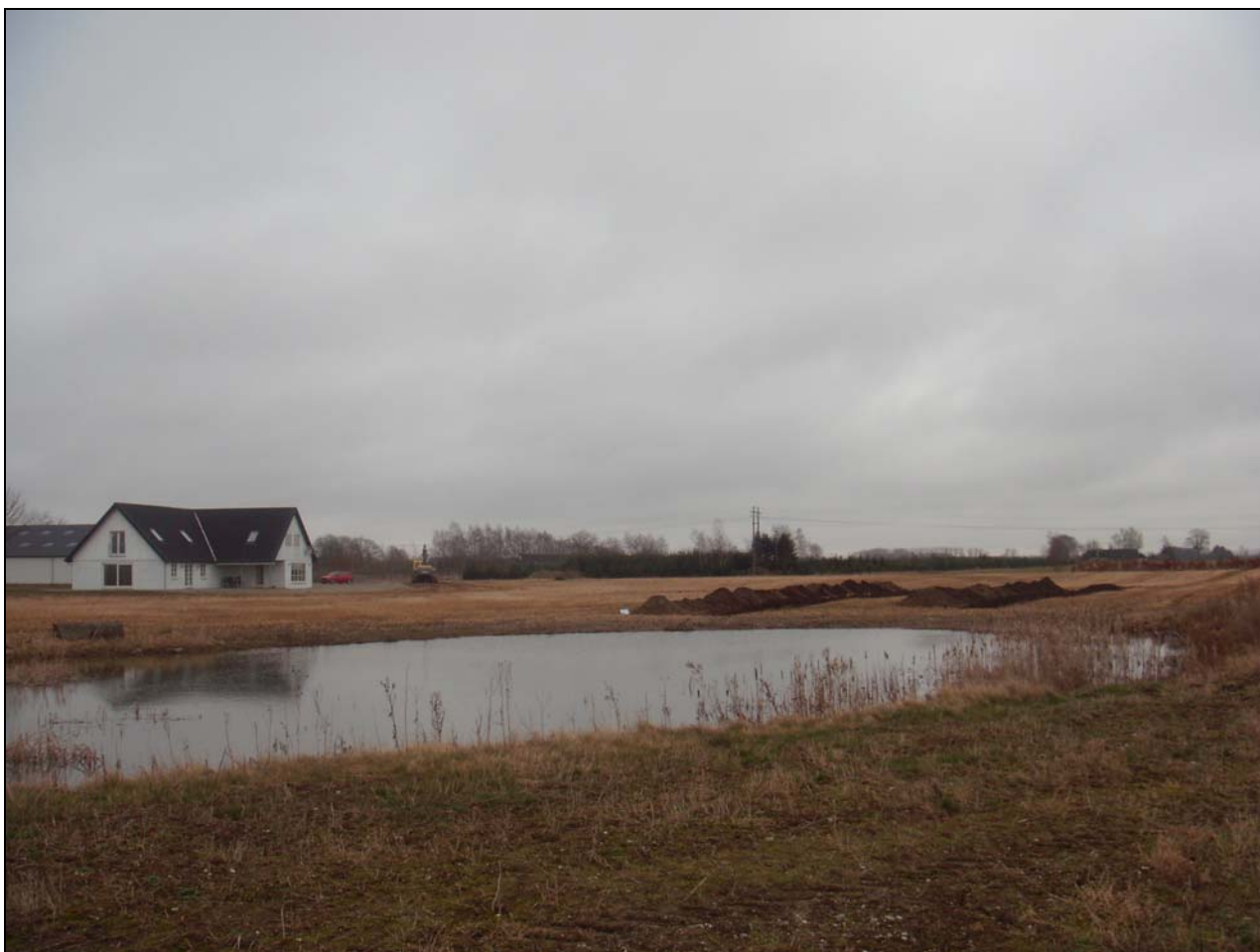
Foto 01267D02. De to søgegrøfter ved den eksisterende sø set fra sydvest.

Forundersøgelsen blev foretaget tirsdag d. 10 marts 2009.