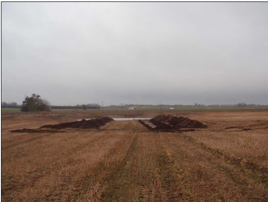
Foto 01267D03. De to søgegrøfter ved den eksisterende sø set fra øst.