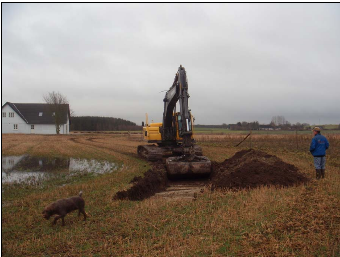
Foto 01267D04. Situationen ved "søen" nordvest for ejendommen. Set fra nord. Bemærk at der allerede står vand på fladen.