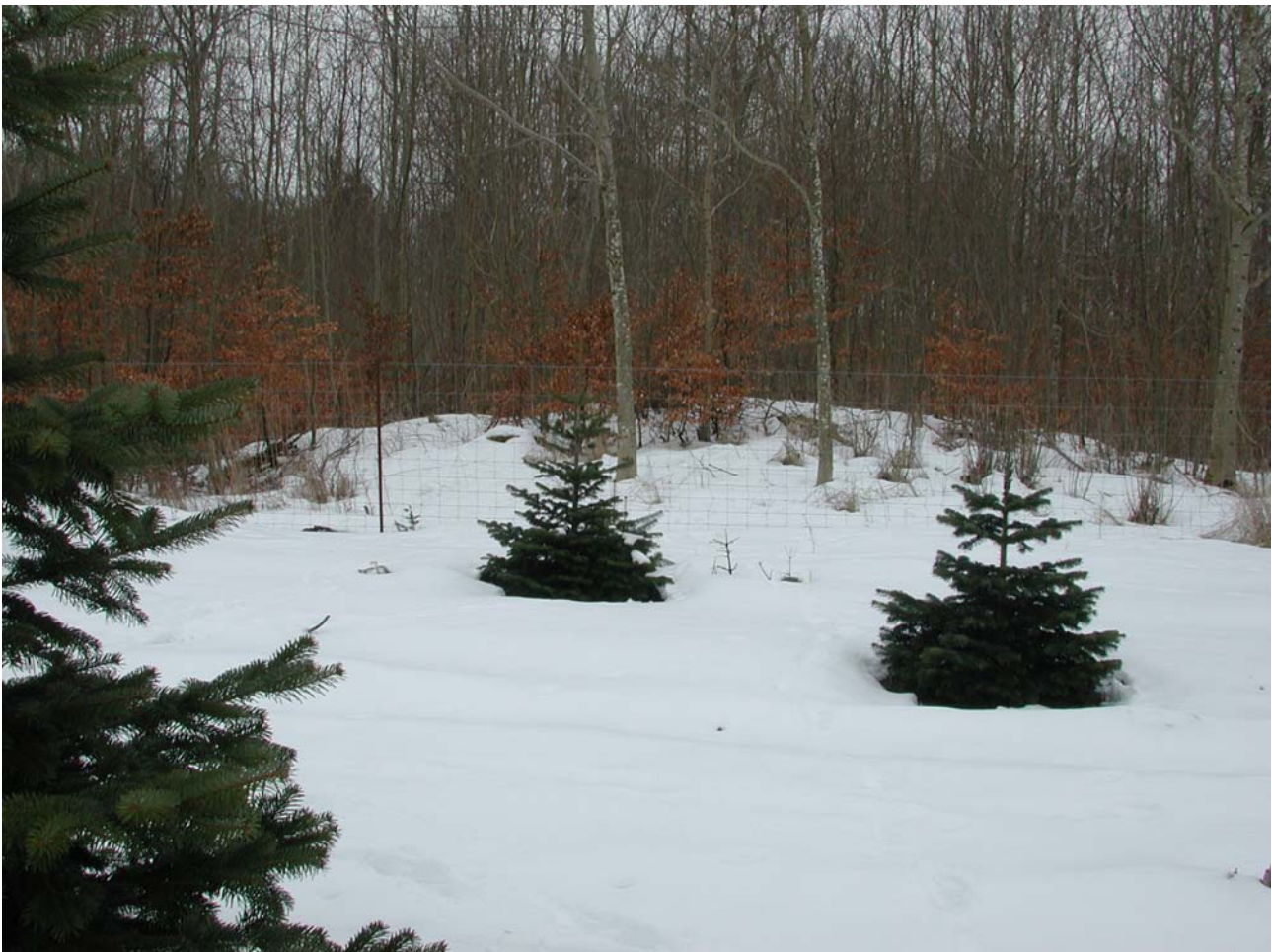
Rundhøjen set fra nord fra område med juletræer/Normannsgraner. Højde af jernpæl ca. 1,5 meter.

Besigtigelse og registrering af rundhøj ca. 15 meter i diameter og min. 1,5 meter høj i ung løvskov (plantet 1985 jf. skovkort).