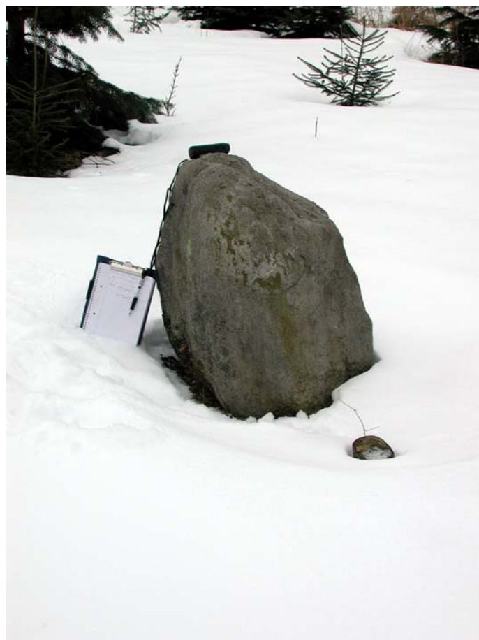
Stående sten ved punkt 012 set fra NV (mappe er A5-format).

Besigtigelse af 13.500 kvm forud for arealbearbejdning til maskinel juletræsdyrkning. En enkelt sten rejst på højkant (punkt 12) er registreret, ellers kun enkelte større, jordfaste sten uden system ved besigtigelsen. Da stenen ikke umiddelbart kan betragtes som fortidsminde er der udtalt at der ikke forventes arkæologiske interesser.