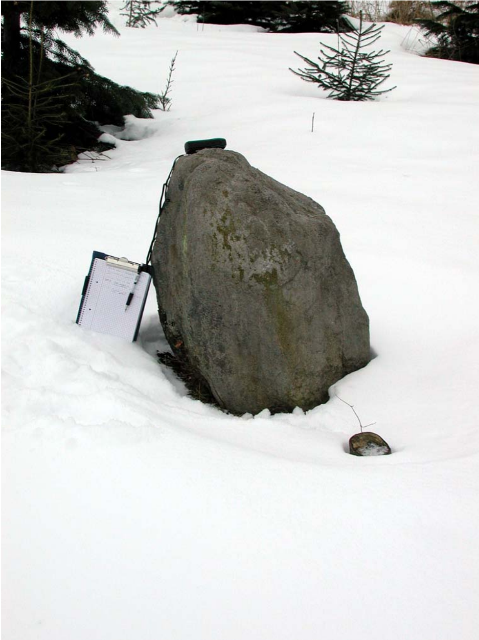
Stående sten ved punkt 012 set fra NV (mappe er A5-format).

Centrum er indmålt (omregnet til UTM Z32 ED50 med KMS Miftrans”) X: 658.773,61, Y: 6.159.564,59.