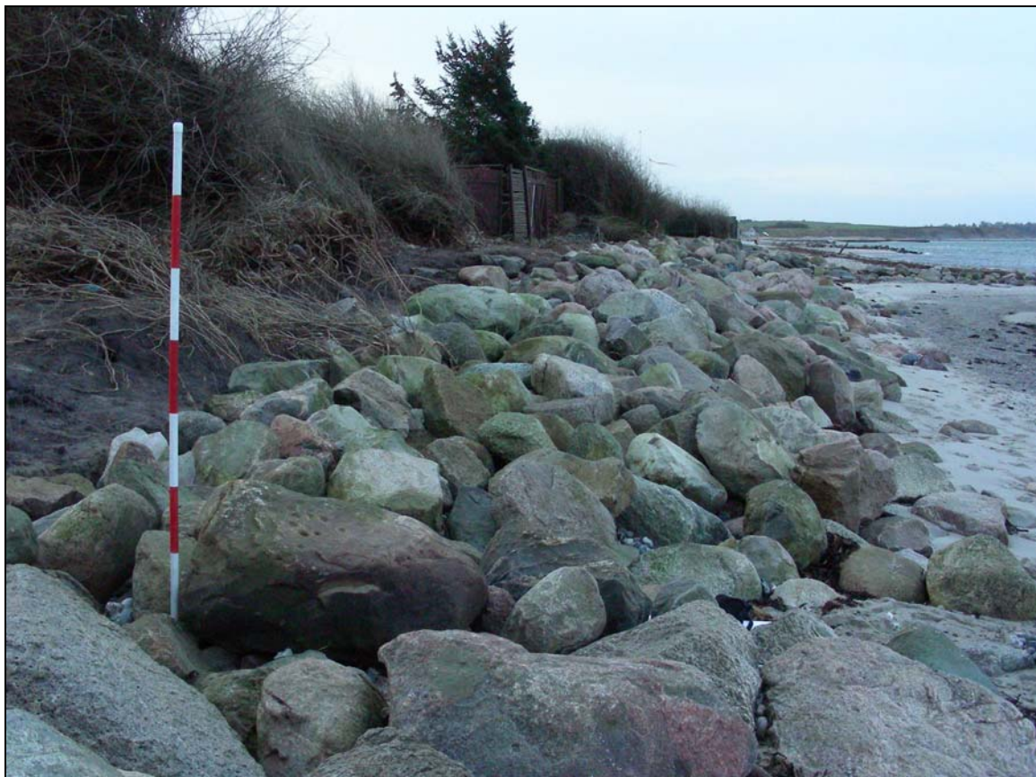
Stenens beliggenhed ved besigtigelsen d. 8/12 2006

Stenen med skåltegnene indgår i de sten der er lagt på stranden som kystsikring. Det er den der ses umiddelbart til højre for landmålerstokken på nedenstående billede.