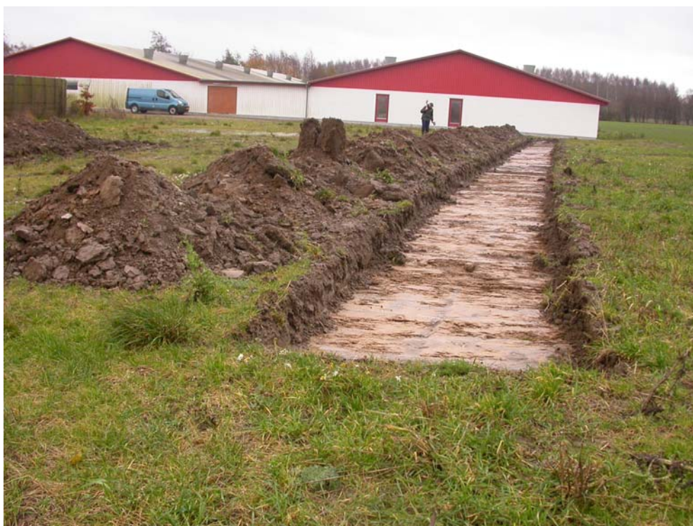
01157D07 søgegrøft 1 set fra øst med den eksisterende del af svinestalden i baggrunden. Morten afsøger den opgravede jord med detektor