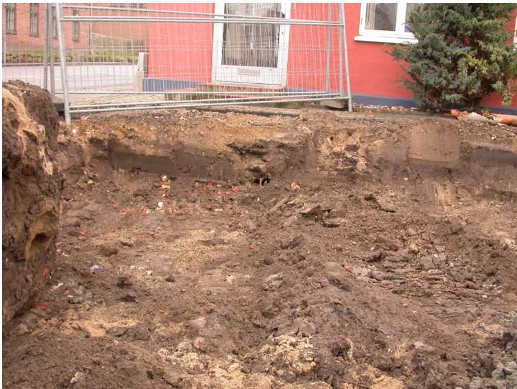
SVM01159D07 Muldlaget med synlige spor af brokker af røde munkesten og gule Flensborgtegl

SVM01159 Bilag 01: digitale udgravningsfoto