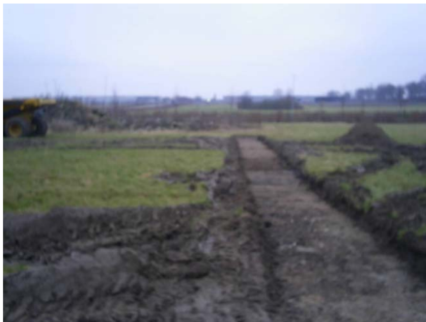
01162D03: søgegrøft 2 set fra syd. Det opfyldte hul set til venstre i billedet bag dumperen.