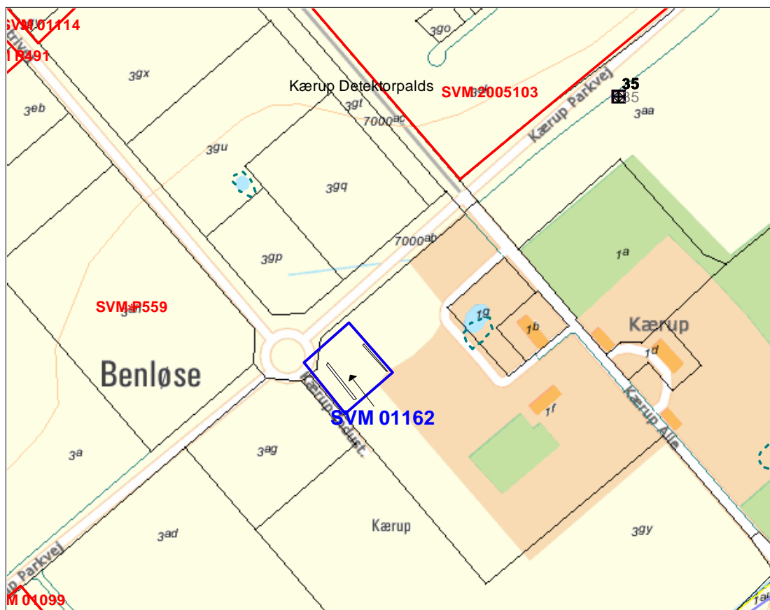
SVM01162 det undersøgte areal markeret med blå, søgegrøfterne er markeret med sort streg © KMS

En stor del af det undersøgte areal udgøres af et vandhul, som er fyldt op med mange store kampesten (syldsten?). Der stod klart vand i kanten af vandhullet og der blev derfor ikke gravet søgegrøfter på dette sted. Terrænet er jævnt, men det skyldes pålagt materiale, mens det oprindelige terræn ikke blev konstateret. Muldlaget er tyndt, 15-20 cm og ligger ovenpå laget med knuste murbrokker, så det er ikke det oprindelige muldlag.