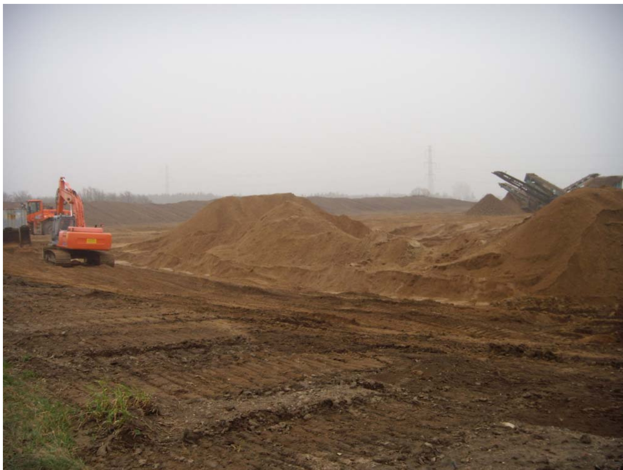
Oversigt over sagsarealet SVM01173-1 Lillevangsvej N1.