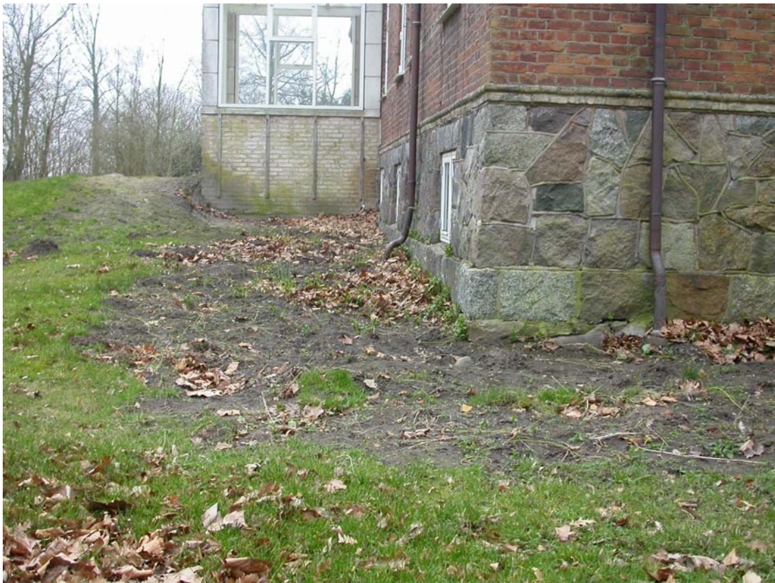
SVM01176D04 opgravning langs sydsiden af stuehuset