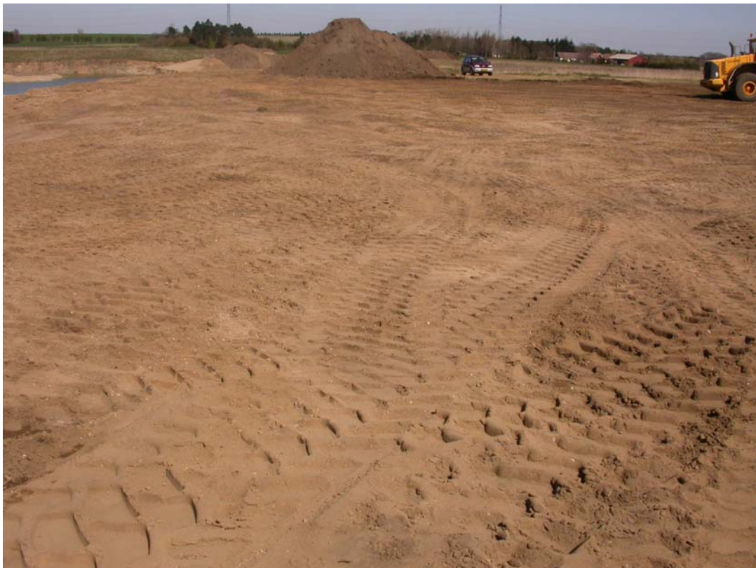
SVM01183D01: det nyafrømmede areal med kraftige kørespor.