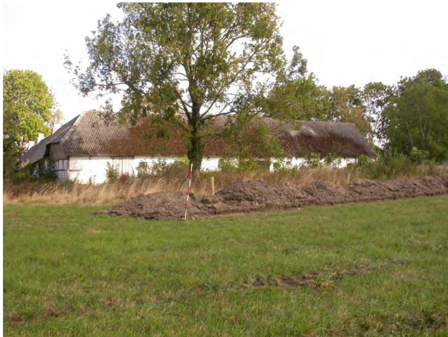
01297D01 Kongsgården og den vestlige del af den nordlige søgegrøft

Resumé. Mindre forundersøgelse af 1600 m 2 syd for Kongsgården gav et par nedgravninger med affald fra den nuværende gårds funktionstid. Opsamling af benskjøjte.