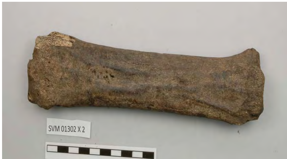
Den opsamlede benskøjte 01297x2

Benskøjten (islægger) er kendt fra vikingetid og middelalder og var stadig i brug i 1800-tallet (Århus Søndervold). Da den er fundet uden sammenhæng kan den være fra hele perioden.