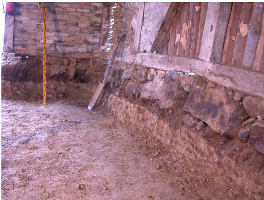
Afgravning i den østlige del af det vestligste rum i sydlængen 01297D16

Besigtigelsen af opgravningsarbejdet gav inden spor efter en ældre gård på dette sted. Forgængeren skal søges mod nordøst eller mod vest tættere på kirken.