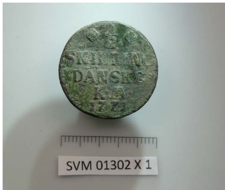
01302x1 forsiden af 1/2 skilling fra 1771

Resume: Detektorafsøgning af 2 arealer øst for landsbyen Vester Broby gav en 1/2skilling fra 1771 samt en blykugle til forladergevær fra samme tid.