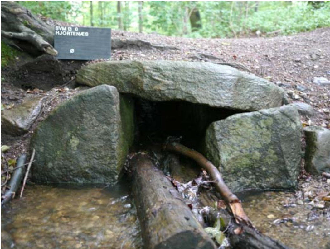
Vejkistgens velbevarede østside, nedstrøms. Foto D2.

Besigtigelse og summarisk dokumentation af vejkiste over Ørbæk Rende nær Sorø sø.