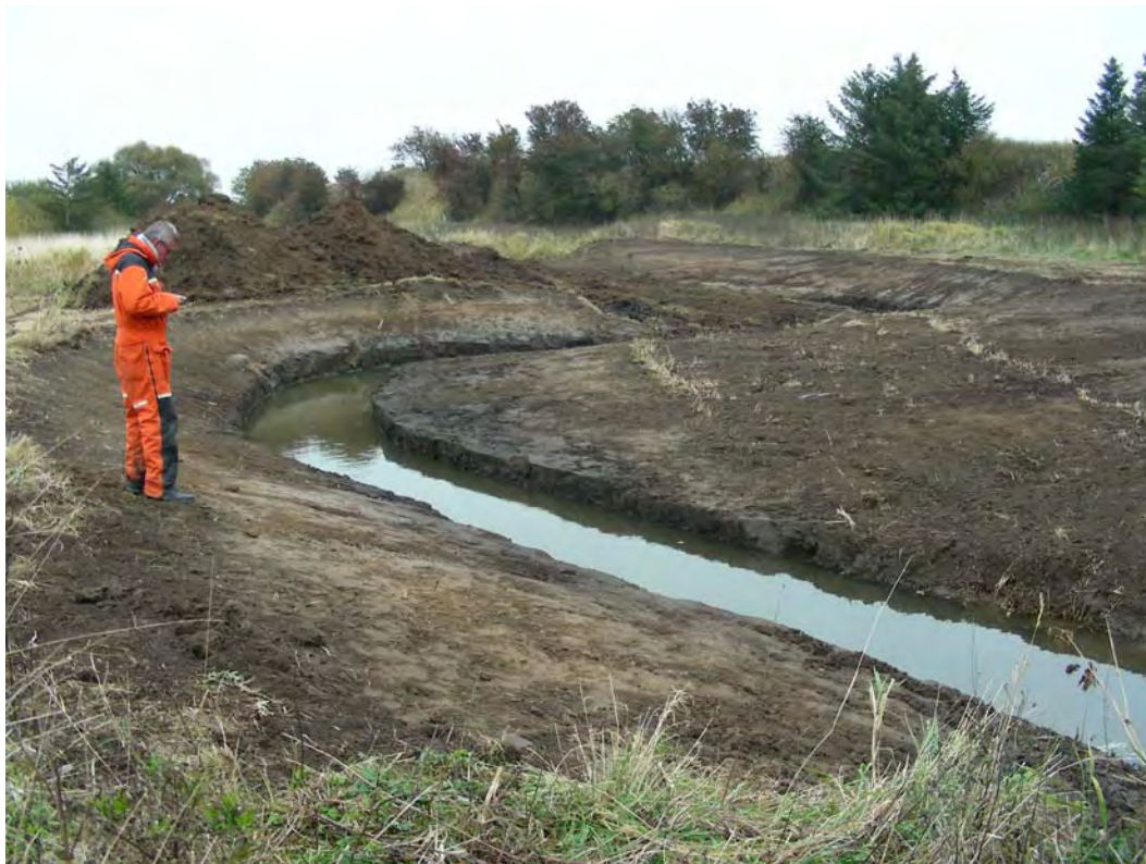
01289D06: besigtigelse af gravearbejdet ved den genslyngede Lindes å.

Arkæologisk overvågning af opgravningsarbejdet af i forbindelse med genslyngningen af Lindes Å på matr. 8a Skørpinge by foretaget i perioden 2/9 til 19/10.