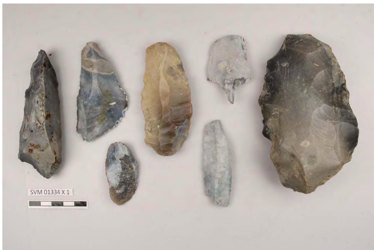
De 7 flintgenstande

Registreringsnotat for 7 flintgenstande opsamlet ved Kongsmark Strand uden nærmere fundoplysninger.