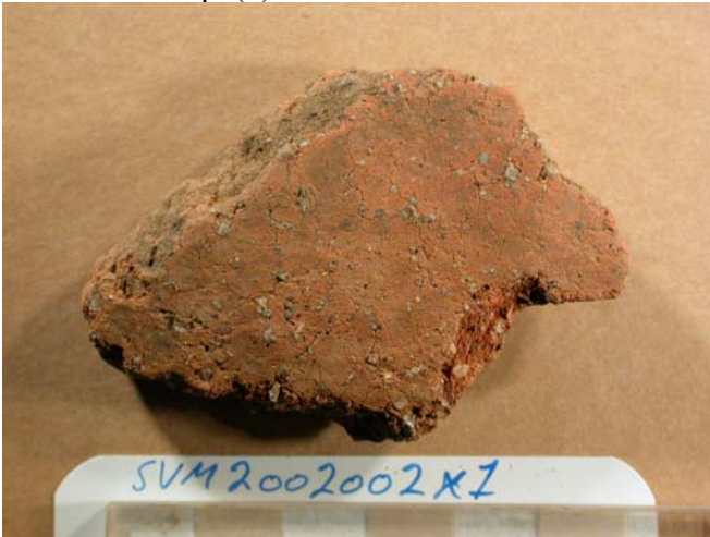
x1, skår fra Anlæg 1