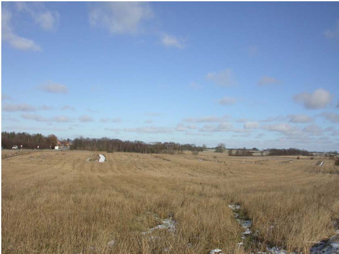
2003038D06 Arealet set mod nordøst. Midt i billedet bakkedraget, hvorpå SB 72 er afsat.

Kortvarig prøveundersøgelse forud for skovrejsning på dyrket areal, hvor der tidligere er opsamlet bopladsflint fra Tragtbægerkultur. Selve bopladsområdet kunne ikke længere erkendes som lag eller anlæg i råjorden, men humant flint, primært skiveskrabere, kunne registreres i pløjelaget. Desuden fandtes enkelte nedpløjede kogegruber af oldtidskarakter.