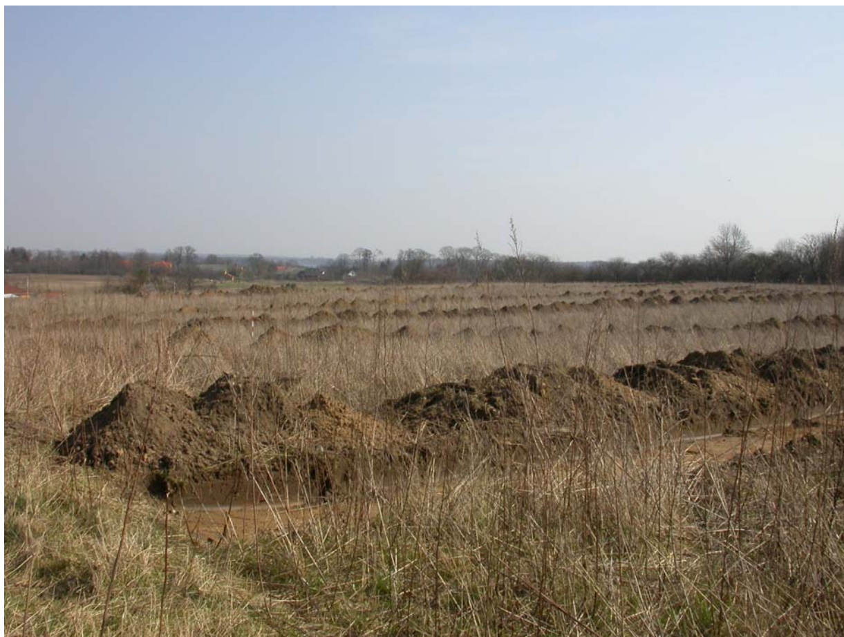
2004003D01. Arealet set fra geodætisk punkt, dvs m. øst. Bagerst skimtes tårnet på Pedersborg Kirke.

Forundersøgelse af ca. 40.000 m 2 forud for byggemodning viste anlæg af forhistorisk karakter, men ikke stolpehuller, kulturlag eller lignende, der tydede på velbevarede bebyggelsesspor.