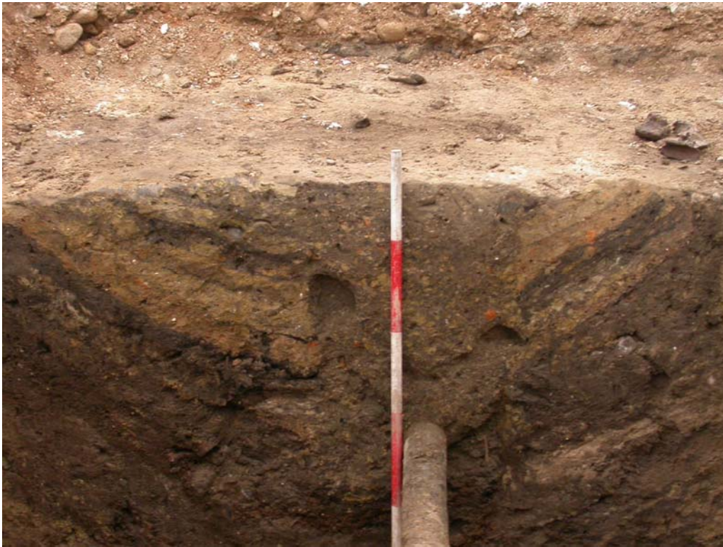
2004005D061 I toppen af brønden A51 ses flere skråtliggende gule lerlag, der tolkes som nedsunkne lergulve af en bygning, som har ligget henover den opfyldte brønd.

På den centrale del af pladsen undersøgte i sommeren 2004 en brønd A6, som i toppen havde rester af en meget regelmæssig brolægning. Denne brolægning var klart yngre end brønden, men dens funktion kunne ikke afklares. Set i sammenhæng med den her undersøgte brønd A51 må det konkluderes, at brolægningen er resterne af et gulv i en bygning, som har stået henover brønden. Samlet giver det spor af en meget massiv bebyggelse i 12-1300-årene i denne del af Slagelse.