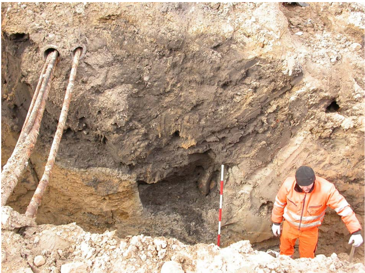
2004005D123Nedgravningen A75 set fra øst d. 28/2 - 2005

Da Kirsten Christensen forlod ”grøften” søndag d. 27/2-2005, kunne det sorte kulturlag, som vi holder øje med, følges 8 meter fra ovennævnte hushjørne. I dette område var man ca.3-4 meter nede, og derfor var af sikkerhedshensyn nedsat en gravekasse af metal. Da jeg ankom om morgenen d.28 var man i gang med at grave på dette sted. I grøftens østside ”sad” resten af endnu en trætønde nede under gravekassen. Dvs. at kulturlaget var specielt dybt på dette sted. Da gravekassen efterfølgende blev flyttet lidt i sydlig retning, fremgik det klart, at der var en større V-formet nedgravning A75 på dette sted! Det er givetvis en brøndnedgravning, der her blev ”snittet”.