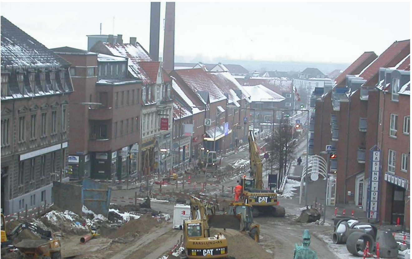
2004005D101: Område 2 midt i billedet. Den bagerste gravemaskine er ved at grave østfeltet.