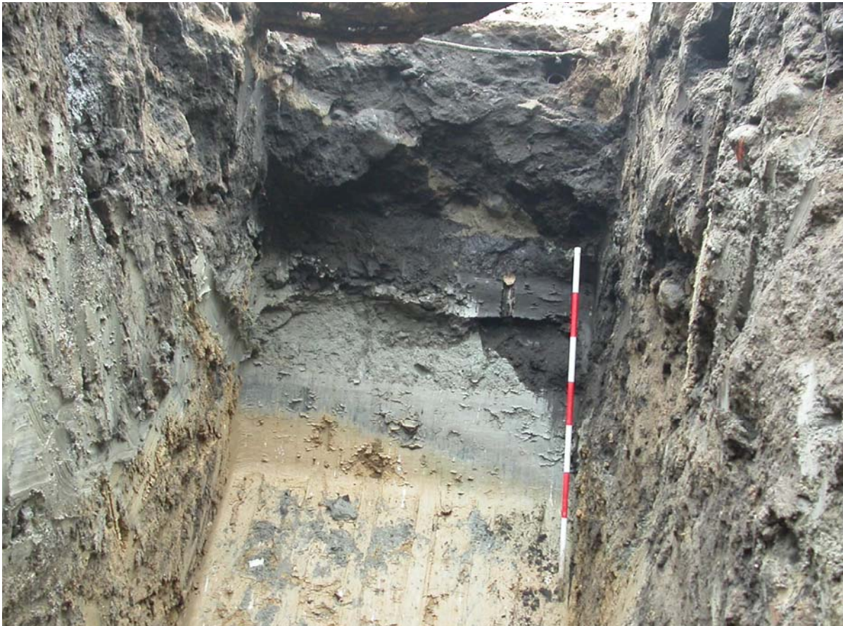
2004005D090: Profilet ud for den nordlige port til Casinotorvet set fra nord d. 18/2 - 2005