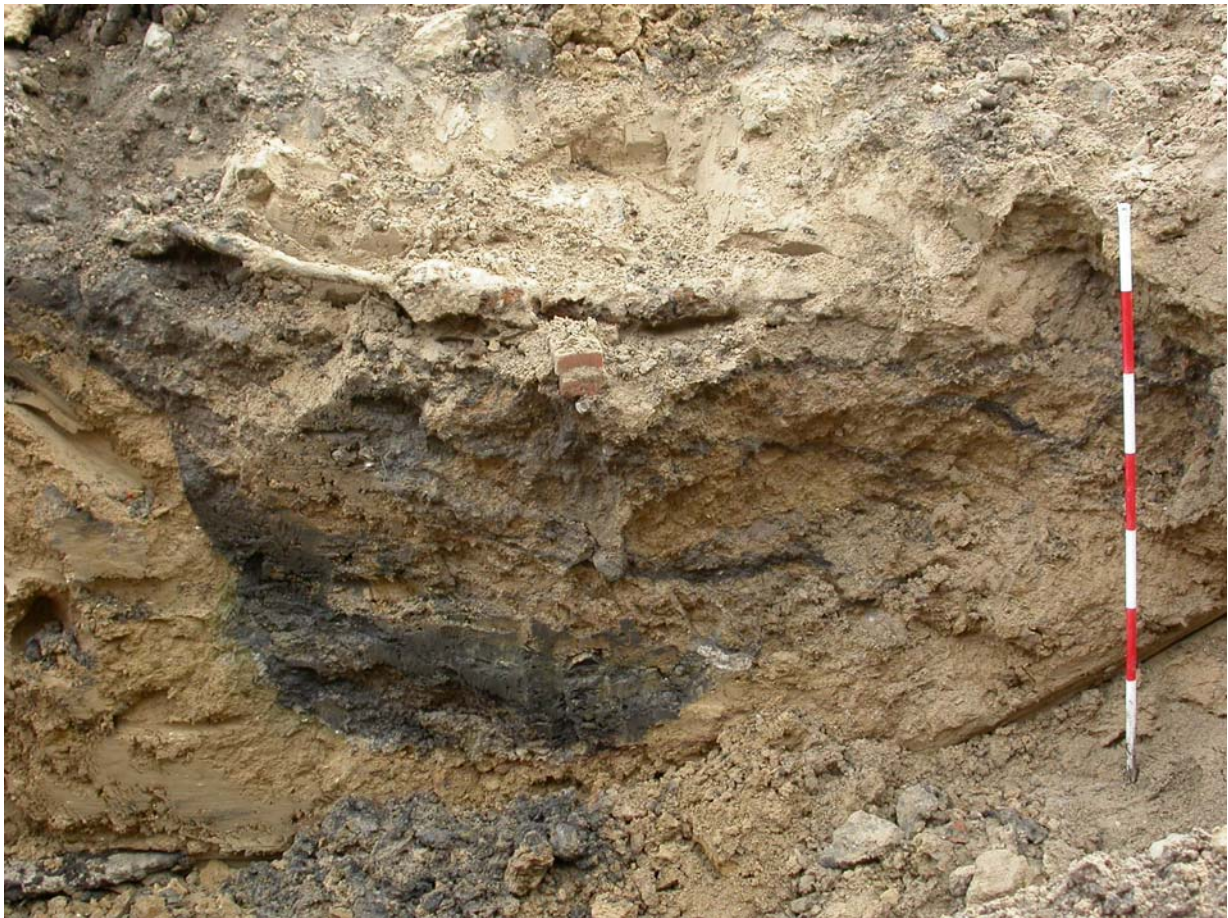
2004005D120. "Renden" A74 set i modstående profil, dvs. set fra vest

Fra dette område er hjemtaget i alt fem fund, der alle kommer fra fylden i det område, hvor tønden sad lige under gravekassen. Det drejer sig om et hankeskår fra en stjertpote og tre glaserede skår med grønlig glasur. Hertil et teglfragment der form. kommer fra tagtegl (20040005x40). "Kulturlaget" slutter 9,5 meter fra sydhjørnet ved Frederiksgade. Der foreligger en skitsetegning af dette sted indmålt i forhold til hushjørner og matr. skel.