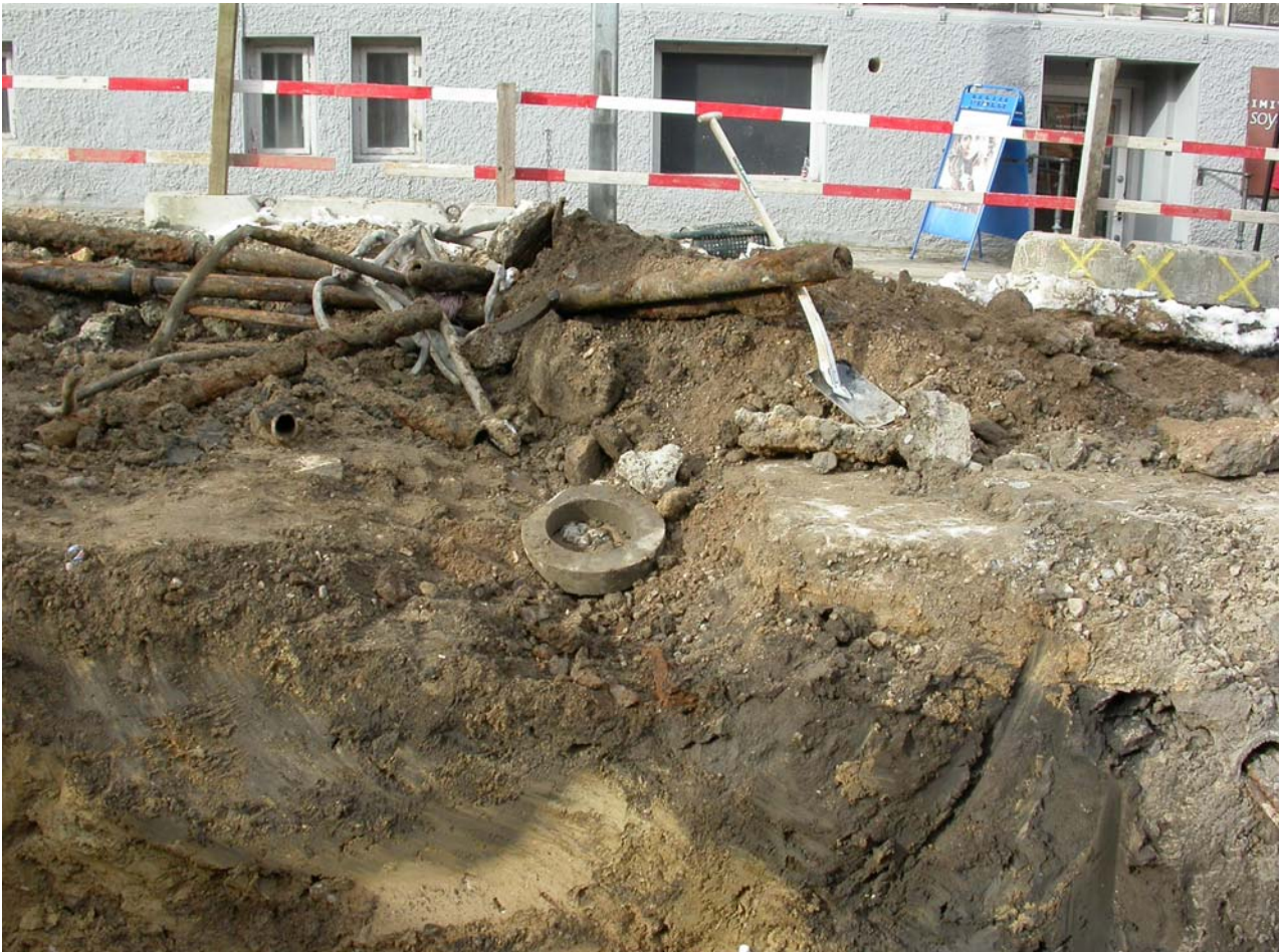
2004005D128: Brøndnedgravningens ( A75) sydlige afslutning, der fortsætter i endnu en nedgravning (A74). Set fra øst.

Anlæggets sydside skråner jævnt, og herefter kom der ren undergrund (brun stiv ler). I forlængelse af det dybe ”brøndanlæg” kunne imidlertid mod syd ses en mindre nedgravning A74 med afrundet bund.