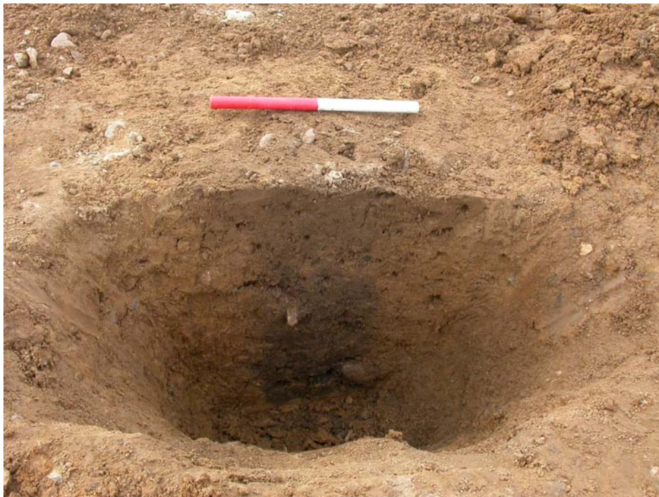
2004011D14. Stolpehul "A77" gennemskåret set fra øst. Sporet efter den tagbærende stolpe i hus 1 ses som en mørk farvning i jordvæggen, som et aftryk af stolpen, der synes optrukket, ved opgivelse af huset.

Af fotografisk dokumentation foreligger både digitale fotos såvel som farvedias og sort/hvide fotos. Amatørarkæolog Morten Pedersen, Slagelse, gik med metaldetektor på området, dog uden at finde metal af forhistorisk karakter.