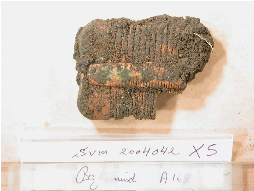
½ dobbeltkæm fremstillet af ben - fundet i anlæg 168.

Lidt længere mod nord i området hvor ledningen krydser Basnæsvejen, dvs. umiddelbart sydøst for Magleby, fremkom en række anlæg af lidt yngre dato. På begge sider af vejen fandt vi fundrige anlæg med et ret stort indhold af østersøkeramik og andre genstandstyper.