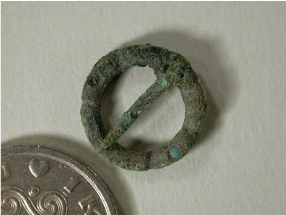
Fint lille ringspænde af bronze fundet i anlæg 168. Bemærk den indsatte turkisblå perle, som modstående har haft en nu mistet parallel. Den indsatte mønt er en 1-krone.

Det var primært affalds- og kogegruber, der her kunne dateres til denne periode.