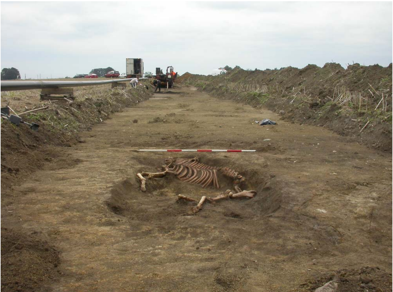
Området ved Bøghsminde set fra nord. I forgrunden anlæg 384. Grøftens bredde er ca. 4 meter.

Rapport over mindre undersøgelse med fund af stolpehuller og gruber fra jernalder og middelalder. Undersøgelsen, der fandt sted i perioden 23 til 25 august 2004, blev ledet af arkæolog Henrik Høier.