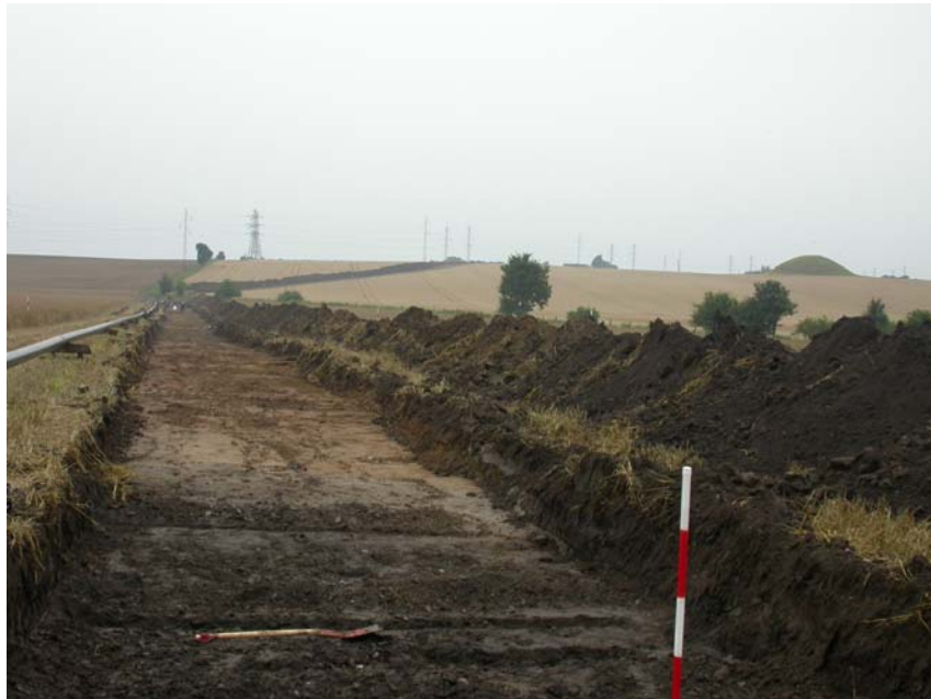
2004047D004: Udgravningsfeltets beliggenhed i forhold til den fredede ”Brakhøj”