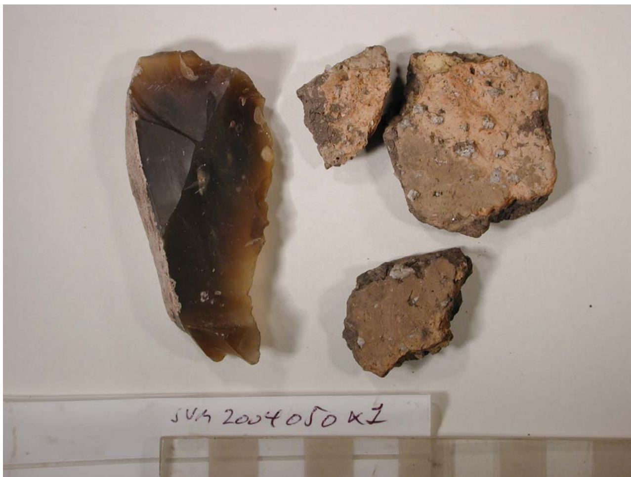
Fund x1. Bearbejdet flint og skår af neolitisk karakter, tragtbægerkultur.