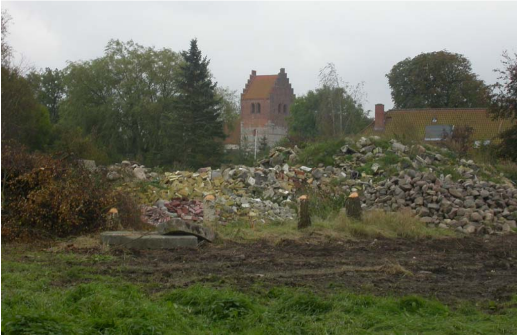
2004055D10. Ørslev kirke set fra undersøgelsesområdet. I forgrunden ses materiale fra den nedrevne gård.

Beretningen for prøvegravning forud for udstykning af byggegrunde i den nordlige del af Ørslev med spredte bebyggelsesspor, formodet oldtid, den 5. oktober 2004 af Kirsten Christensen.