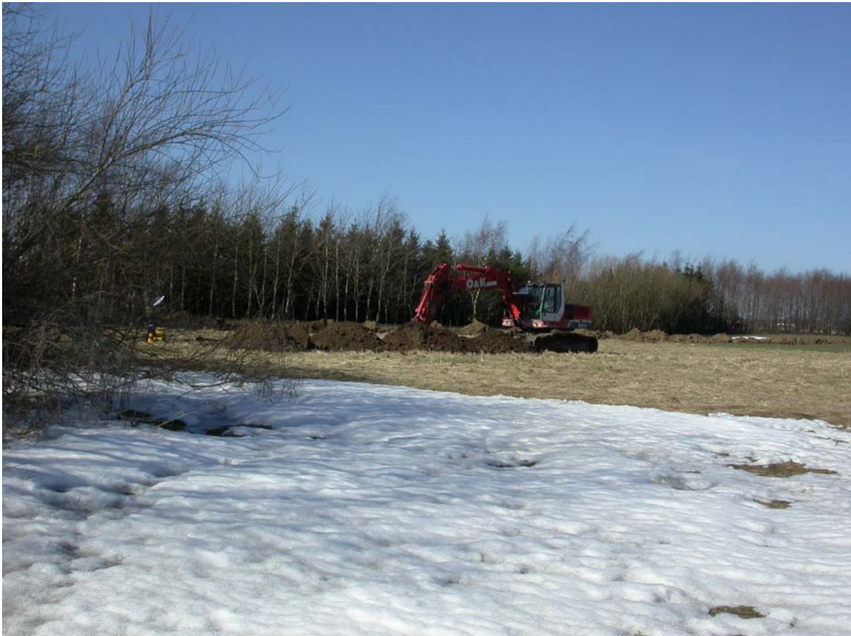
Gravemaskinen arbejder ved den sydlige del af grøft 2 d. 21 marts 2005

Området findes på 4cm kort 1412-1 NV. Overordnet er det lokale terræn ret fladt. Det undersøgte areal ligger imidlertid lidt højere end de nærmeste omgivelser med højdekoter mellem 44,2 og 47,3 meter o.D.N.N. (jvf. landmålerdata bagerst). Indenfor byggemodningsområdet findes imidlertid også et par mindre lavninger, der på tidspunktet for undersøgelsen var vandholdige efter det tidlige forårs sneafsmeltning (jvf. de indsatte fotos).