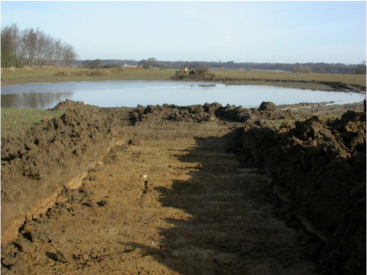
Udsigt over arealet set fra syd d. 21 marts 2005