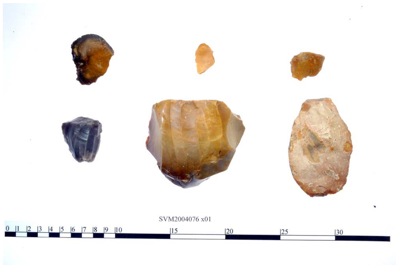
Genstandsfoto af indleverede/registrerede oldsager.

Flintoldsager, heriblandt to enpoledede blokke med spor af småflækker fundet i og ved lavning i småkuperet terræn i område med en del bearbejdet flint jf. finder og ejer. Fundene angives fundet i område syd og sydvest for bebygget grund mod nord.