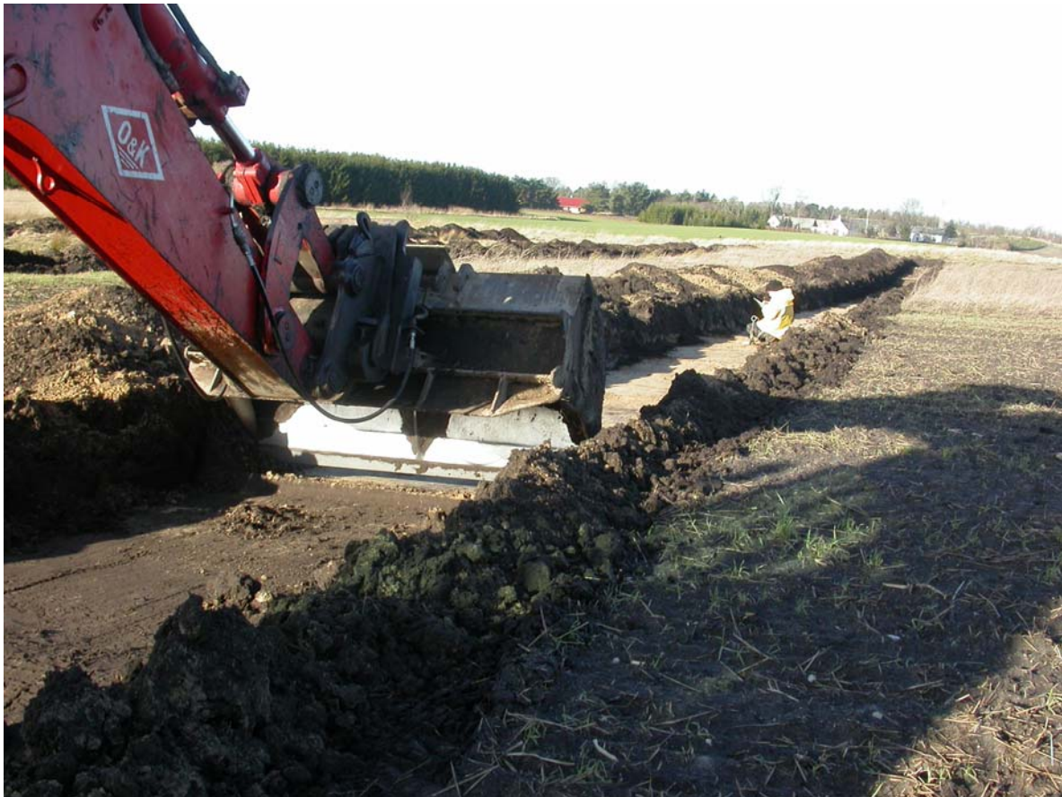
Gravemaskinen arbejder vestligt på arealet