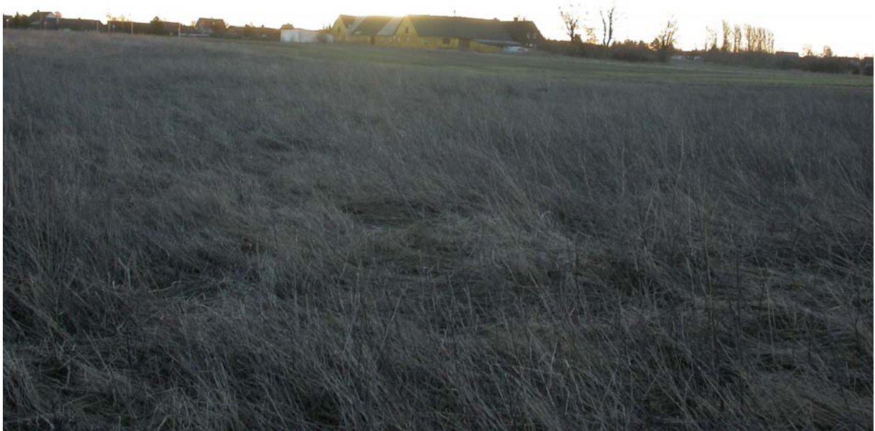
Vintersol over Slettebjerggaard om morgenen d. 1 februar 2005