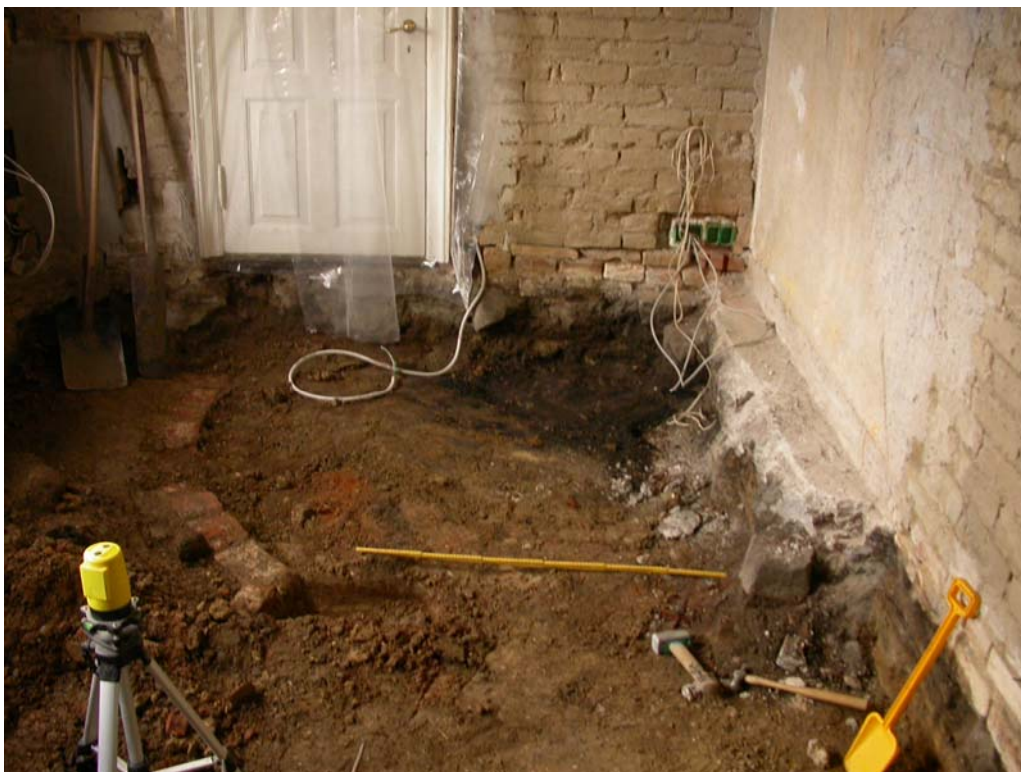
SVM2005021 Ovnanlægget som det fremstod ved besigtigelsen, set mod øst

Besigtigelse af ovnanlæg med rest af ildsted og ovnkappe. Ovnene ligger i hus fra 1877, men kan være fra et ældre hus på stedet, da den ikke følger rumindretningen i det eksisterende hus. Ingen daterende fund.