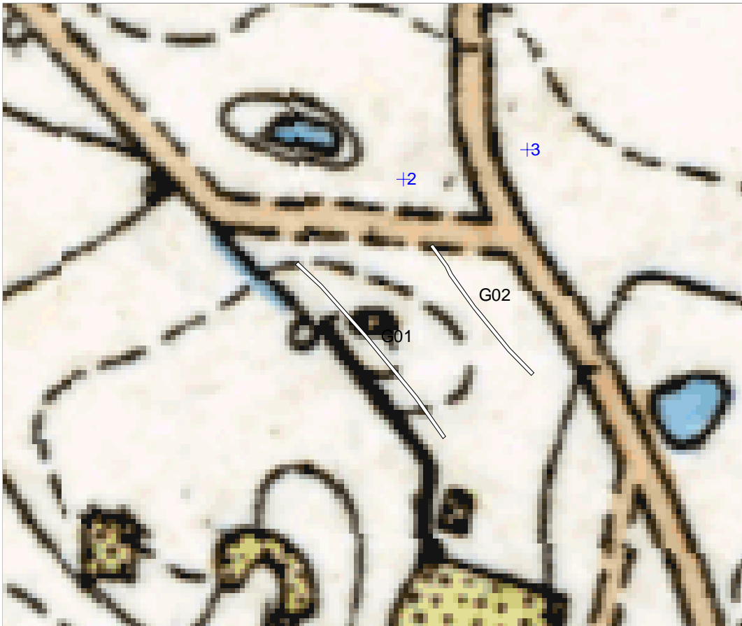
Søgegrøfterne (hvide) og sogneregistreringens punkter (blå) med baggrund af "Høje Målebordsblade" fra ca. 1880.