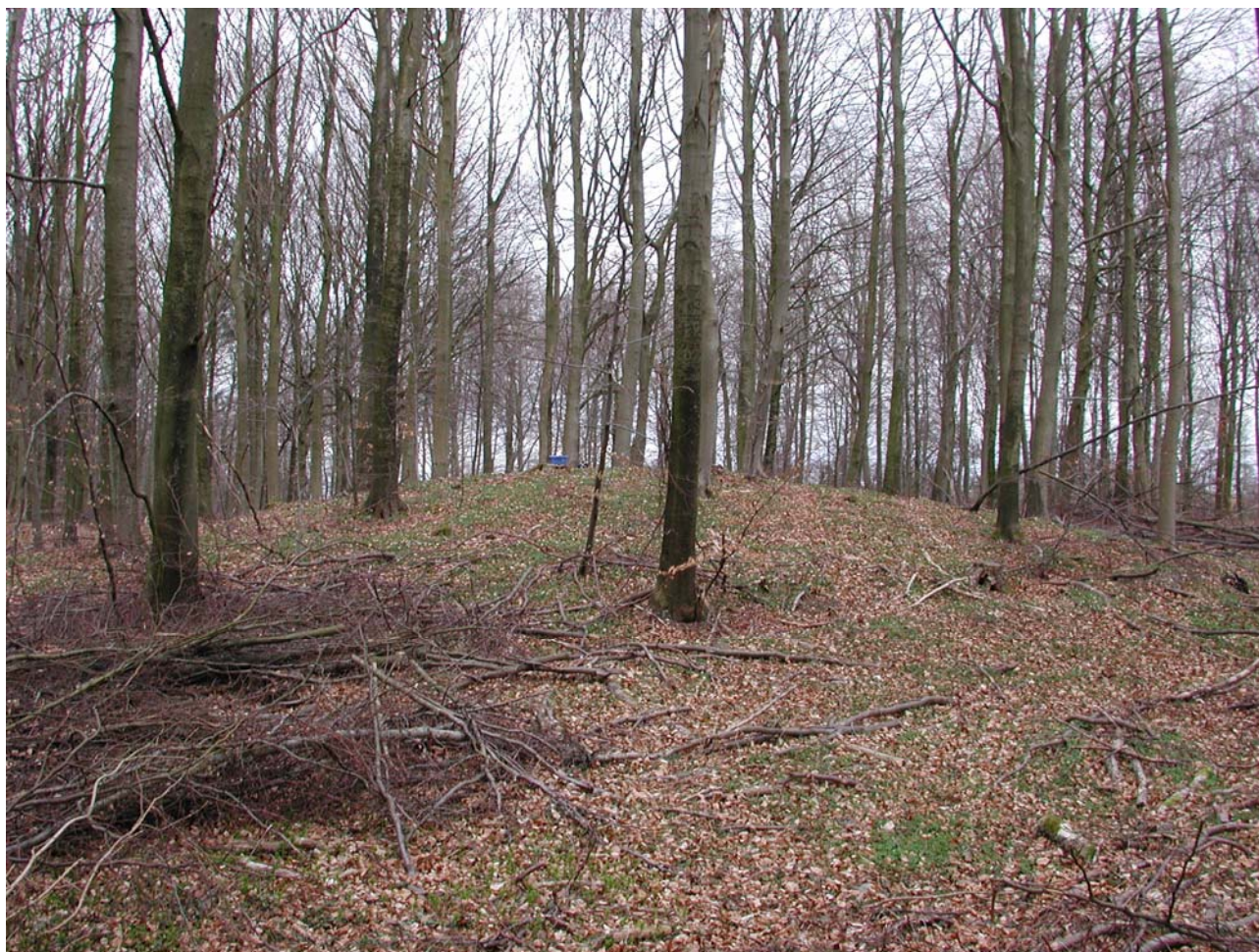
Højen set fra SV mod NØ, på toppen en blå plastkasse. I forgrunden ses digegrøft, der ligeledes optræder på kort fra Vestsjællands Amt over fredede diger. (2005030D03.jpg).

Besigtigelse og registrering af formodet gravhøj i skov. Ca. 12-15 meter i diameter med bevaret højde på ca. 1,25 meter. Ingen synlige randsten. Sydfoden gennemskåret af digegrøft.