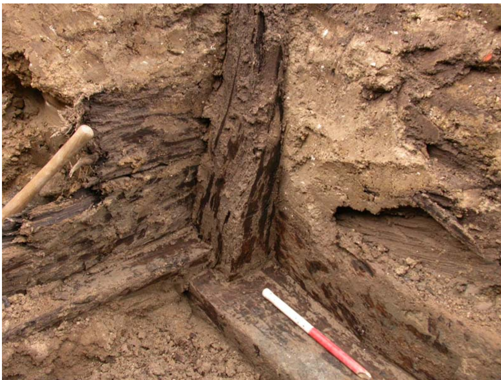
D067 den lodrette stolpe fastlåser konstruktionen af brøndkassen

Den ene af de to brønde havde bevaret det nederste af en firkantet brøndkasse. Brøndkassen var ca 2,5 x 2,5 m og bestod nederst af flækkede stammer liggende på den runde side og med den flade side op. I begge ender af de flækkede stammer var der en firkantet udskæring og hele trækonstruktionen blev låst sammen af en lodretstående stolpe i hvert hjørne. Oven på det nederste skifte var sat kantstillede planker, bevaret i op til 3 lag, som har udgjort selve brøndkassen. Plankerne var ikke fastgjort til de lodrette stolper, men sad udelukkende i spænd mellem disse og nedgravningskanten til brønden.