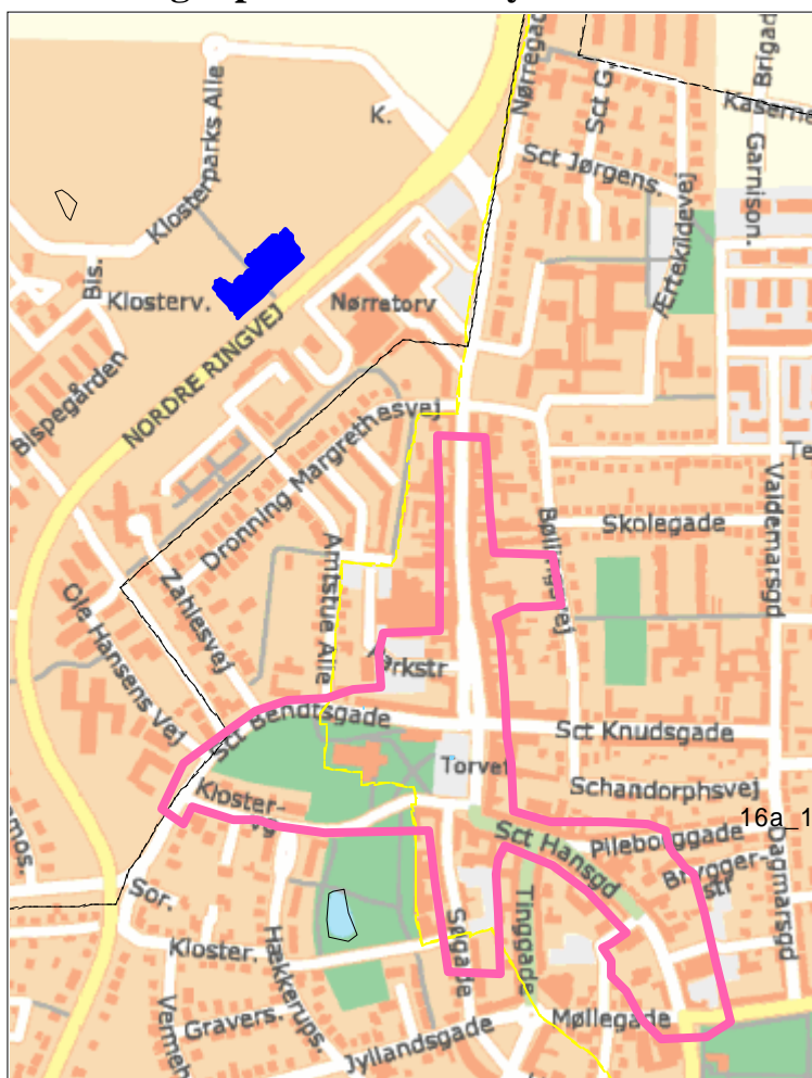
Udgravningsområdet markeret med blå, middelalderbyen og klostrets omfang markeret med lyserød sat ind på et moderne kort

Den udgravede bebyggelse ligger udenfor den middelalderlige del af Ringsted by, men den ligger på jord, som har hørt under benediktinerklostret. Klosters marker har bestået af 10 – 15 m brede ”højbede” med smalle grøfter imellem og ved forundersøgelsen fandt vi mange spor af disse grøfter. Vi går ud fra at husets beboere har passet denne del af klostrets marker. De har formodentlig været tilknyttet klostrets som lægbrødre og ikke som fuldgylde munke.