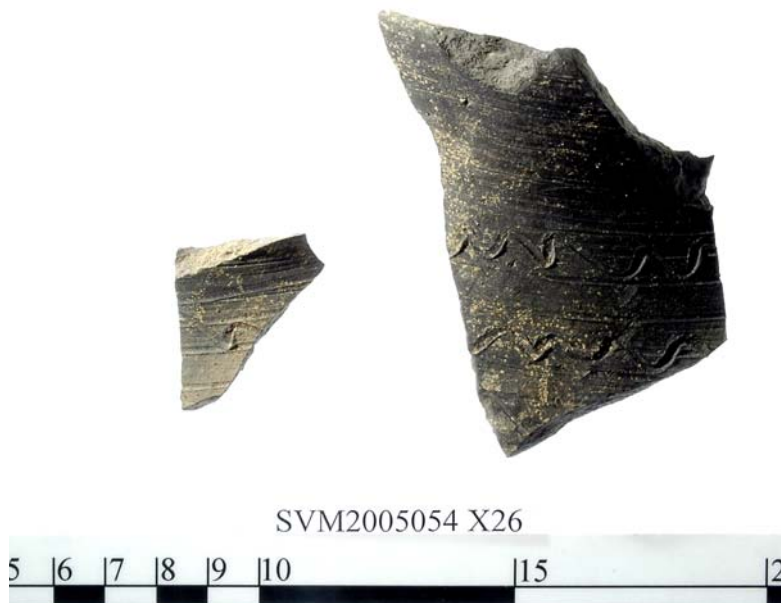
Eksempel på østersøkeramik dekoreret med dobbelt bølgelinie

Størstedelen af keramikfundene udgøres af grå, uglaserede skår af Østersøkeramik. Lerkarrene er opbygget af sammenbankede lerpølser og deres udformning er blevet forbedret ved en efterdrejning på en langsomt roterende drejeskive. Samtidig blev karrene dekoreret med bølgelinier, vandrette furer eller skråhak. Skårene er dernæst brændt ved en meget høj temperatur, som har gjort den næsten vandtætte.