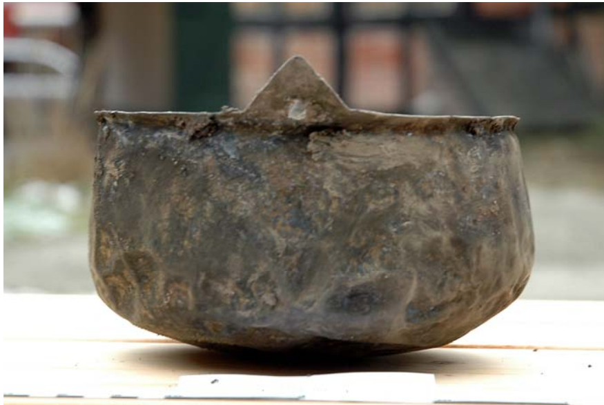
Kobberkarret fra bunden af den ene brønd

Fundmaterialet består af keramik, knogle, træ og metal og det kommer fra brøndene, affaldshullerne og stolpehullerne.