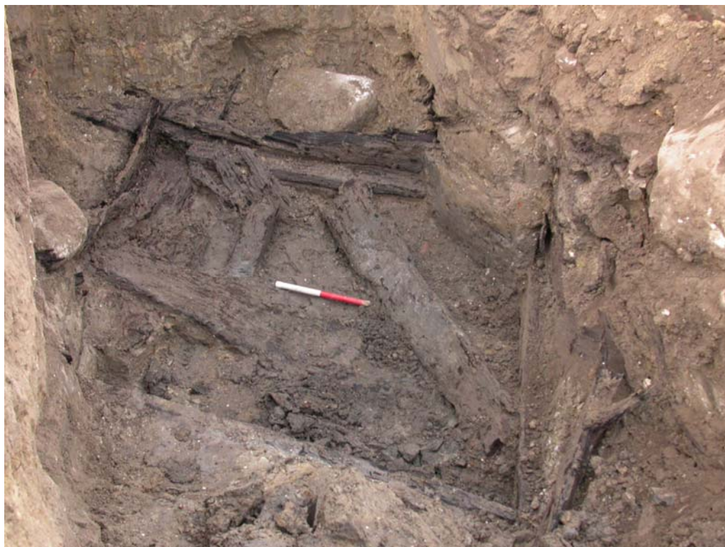
Den firkantede brøndkasse fyldt op med affaldstræ