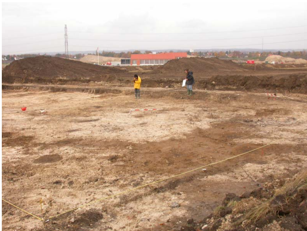
Vara og Kirsten registrerer stolpehullerne i hus I.

Ved forundersøgelsen blev gravet 10 grøfter spredt over byggegrunden for at klarlægge udbredelsen af anlægsspor. Ved den egentlige udgravning blev muldlaget på udgravningsfeltet fjernet med bulldozer og gravemaskine og de fremkomne anlæg blev markeret. Alle bebyggelsessporene blev