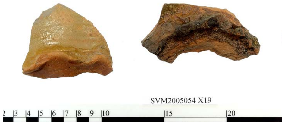
2 bundskår af glaseret kande med de karakteristiske fingerindtryk

1300-tallet. I jordbunkerne blev opsamlet et par skår af en lille drikkekande af stentøj, som blev importeret fra Rhinområdet i løbet af 1300-årene.