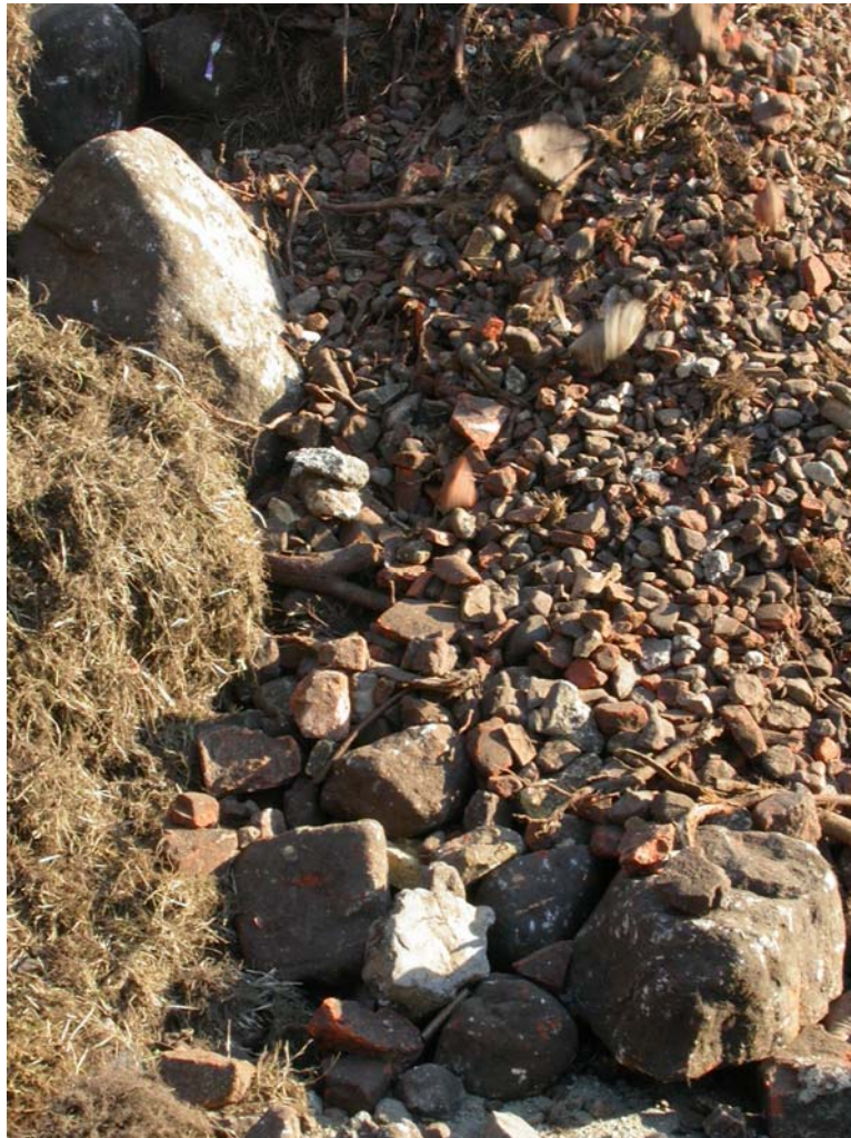
SVM2005064D05: Nærbillede af brokkebunken