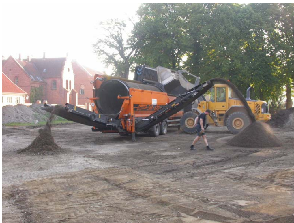
SVM2005064 Soldningen i gang: brokker til venstre og muld til højre

Overvågning af soldning af jord opgravet på Store Plads gav ingen fund.