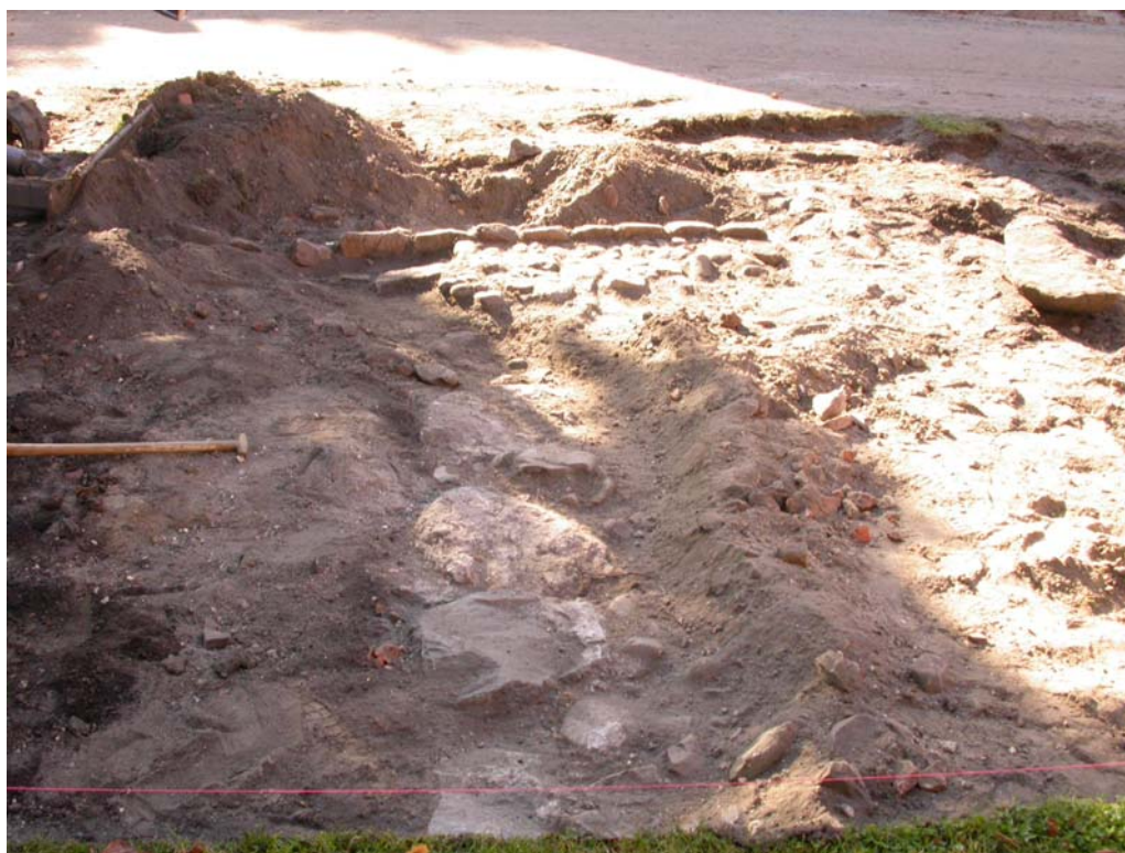
2005102D05: syldstensrækken set fra nord med den overliggende brolægning i baggrunden