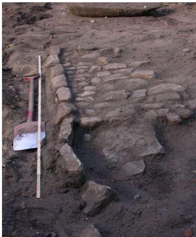
SVM2005102D01: brolægning A02 set fra øst