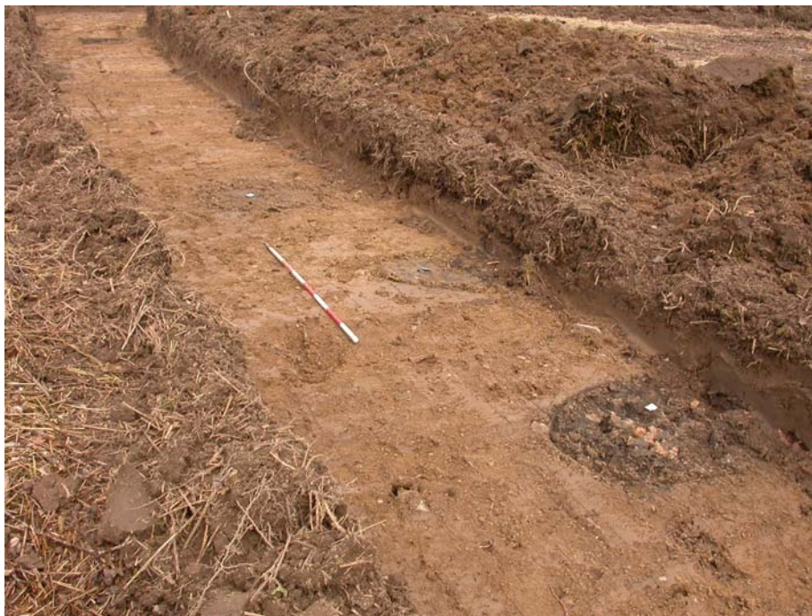
2005109D18: eksempler på kogestensgrubernes bevaringsgrad