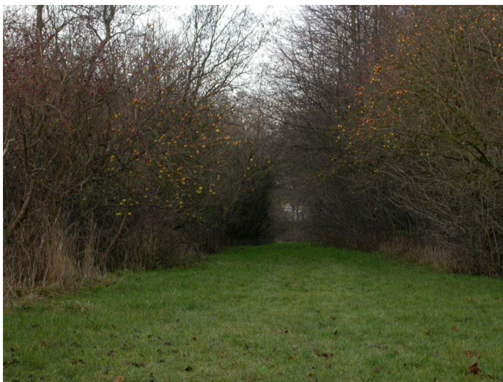
SVM2005109D02 Den vestlige del af stien fra gården Liselund mod vest mod skolen.

Besigtigelse af tidligere frugtplantage forud for udtalelse i forbindelse med lokalplanforslag