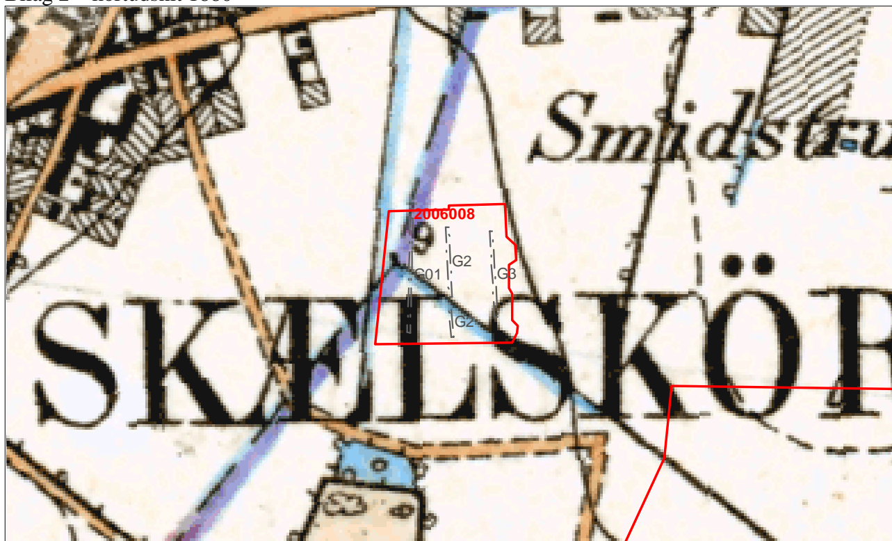
Sagsareal (rødt). Baggrundskort Maalebordsblad ca. 1880