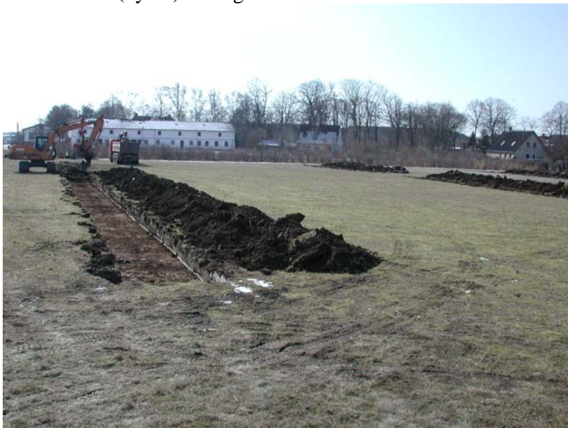
Søgegrøfterne set fra NNV, søgegrøft 3 under tildækning. I baggrunden Guldagergård.

Forundersøgelse af ca. 9.000 kvm forud for byggemodning. Der blev fundet enkelte gruber af forhistorisk karakter og desuden agerrener parallelt med matrikelskel samt nyere markvej i gammelt skel og affald fra lerklinet hus (nyere) i en agerren.