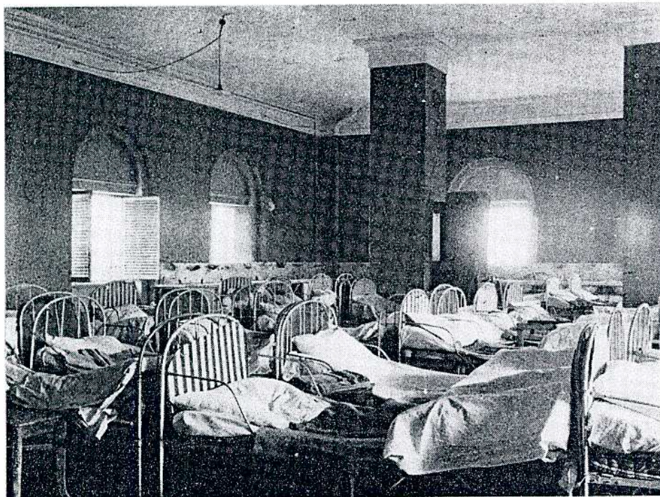
Sovesalen i Akademiets hovedbygning fotograferet i tyverne.

Og når man så hen på fo frem til den sidste april, hē ejendommelige »overskæring« tobak, når de i flok og følge ven og lod toget køre nogle på skinnerne. Den aften anla huer. På tilbageturen gik ma geled og afsang alle slags sk: »Mallebrok« o. s. v. Ved hje man fra skolens Fratergårds- fra byen fremmodte borgere optrådte afgangsklassen u »Der står et træ ved gymn: det har stået der så længe« næsten om den tyske sang vor dem Tore da steht ein Lit