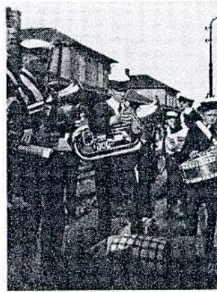
Soldaterkorpset på Soro L. 1922—23.

Naturligvis indeholder et så langvarigt skoleophold mange flere enkeltheder. Og da