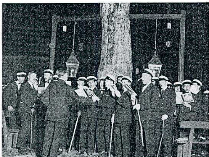
Fra »Overskæringen« i 1924: De vordende studenter synger på »Trekanten«.