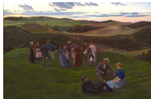
Fritz Syberg: Aftenleg i Svanninge Bakker . 1900. Faaborg Museum.

Forårets bustur går til Faaborg Museum lørdag den 6. april.