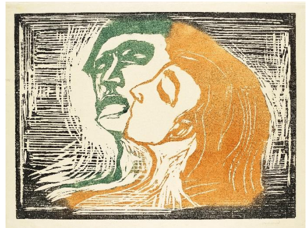
Edvard Munch: Hoved ved hoved. 1905. Træsnit. Norsk privatsamling.