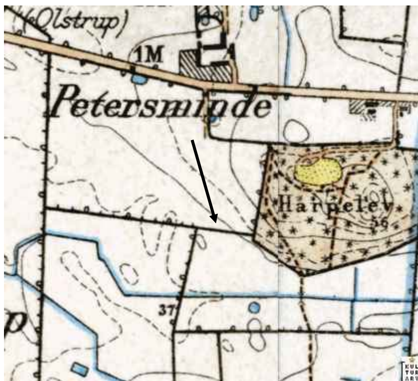
Målebordskort ca. 1900 med angivelse af det øst-vest forløbende dige

Der blev taget flere oversigtsbilleder af selve udgravningsområdet, jf. fotoliste.