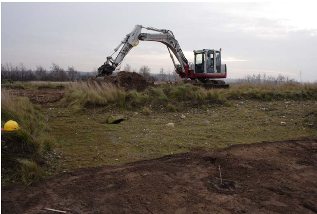
Omr. I under afrømningen – den grønne flade i forgrunden er en af de udvidelser, der havde stået åbne siden forundersøgelsen.

Område I + II blev gennemgået med metaldetektor, men uden fund af oldsager.