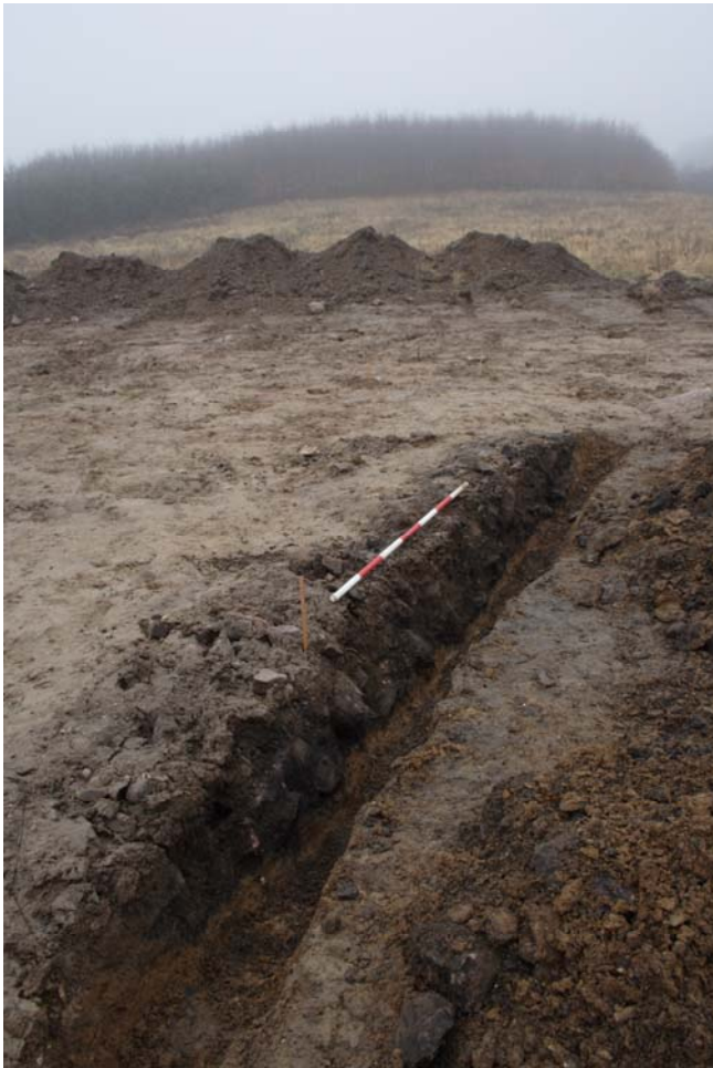
Kogegruberenderne var tæt pakket med brændte sten.