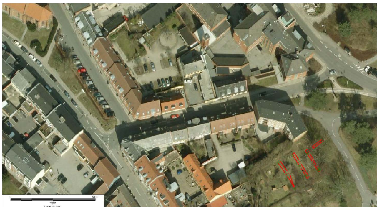
Figur 4: Luftfoto med grøfterne.