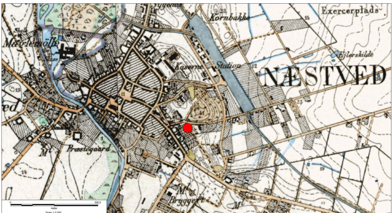
Figur 1: HøjeMålebordsblade med placering af undersøgelsesområdet.

Byggegrunden Østergade 13, Sb.nr. 050707-184, befinder sig indenfor det udpegede kulturarvsareal for middelalderbyen Næstved, ikke langt fra Sct. Mortens Kirke. Ca. 100 meter øst for udgravningsfeltet fandt man ved Amtsmanshaven i 1985 begravelser med resterne af 8 individer, der alle viser tydelige tegn på at være halshuggede (NÆM 1985:700, sb.nr. 050707-39). Ved mindre udgravninger og besigtigelser i området er fundet keramik og gruber fra 1600 tallet til nyere tid (NÆM 2000:105, sb.nr. 050707-145)