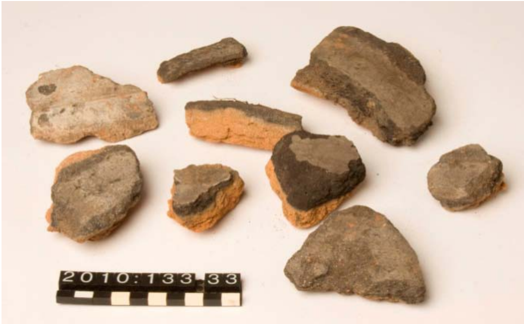
Figur 5: X33 Støbeformdele med aftryk.

afrensning i Grøft II, III og IV. I de førnævnte lag, der alle ligger i sydøstdelen af byggegrunden, er også fundet brændt ler, trækul, slagge, dyreknogeter (nogle farvet irgrønne, hvilket tyder på tilstedeværelse af kobberlegering i jorden), et fragment af en sortglaserede kachel samt keramik; herunder hornbemalede- og stjernepotteskår. Lagene dateres til 1600-tallet. Støbeformdelene havde aftryk af den gryde, kande eller klokke, der er blevet støbt med dem.