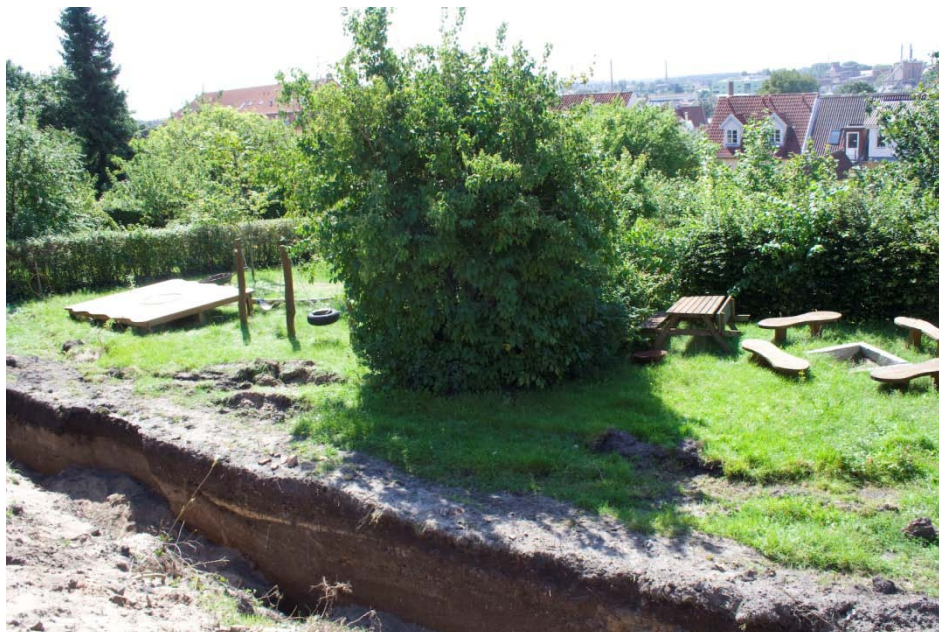
Figur 3: Grøft I med udsigt ud over byen.

Undergrunden består af sand, til tider gruset, i gule, orange og brune nuancer.