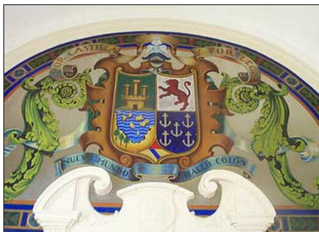
Columbus' våbenskjold var det synlige bevis på den opnåede adelstand. De øverste felter viser kongeparrets symboler, mens de 5 ankre og de opdukkende øer demonstrerer Columbus' betydning på havet og i Den nye Verden.

Til sidst gav kongeparret sig, og Columbus kunne begynde sit livs opdagelsesrejse nr. 1.