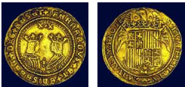
Det spanske kongepar Ferdinand og Isabella og deres fælles våbenskjold trykt på guldmønter, 1469-1504

Columbus var lige så fattig på guld, som han var rig på ideer. Derfor havde han brug for pengestærke sponsorer til at finansiere sin rejse. Den portugisiske konge, som han først besøgte, var ikke interesseret i planerne, men efter nogen overtalelse lykkedes det at få det spanske kongepar Ferdinand og Isabella med på ideen.