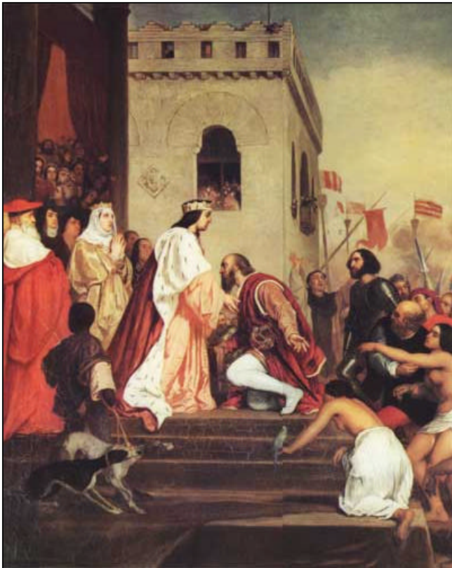
Columbus, hjemvendt fra den 1. rejse, modtages af det spanske kongepar, som havde investeret store summer i hans eventyr.

Columbus vente hjem til Spanien i triumf. Han kunne med stolthed overrække det spanske kongepar nyheden om de nye landvindinger i Indien. Kina og Japan måtte ligge lige i nærheden, fortalte han!