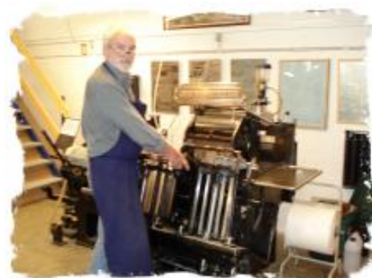
Heidelberg vingeautomat. Vel nok den mest populære trykmaskine for en del år siden.