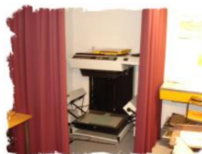
Reprokamera, der blev brugt til forstørrelser og affotografering af forskelligt materiale.