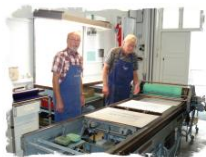
Prøvetrykspresse. Offsetpresse, som stammer fra Pakko Tryk. I dag fremstilles der kunsttryk på den.