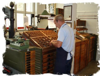
Hånd sætteri som det så ud i et ældre bogtrykkeri.