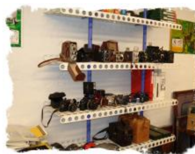
Udstilling af indleverede foto- og småfilmsapparater.