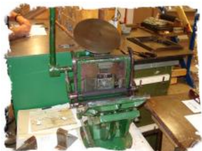
Fluesmækker. På fluesmækkeren blev der trykt visitkort, manillamærker m.m. I dag meget brugt til trykning af servietter.