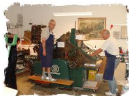
Eickhoff trykmaskine. En meget populær trykmaskine, som bl.a. trykker vores kalender.