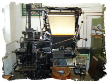
Linotype sættemaskine. Sættemaskinen er fra ca. 1940. Sættemaskinen blev opfundet af tyskeren Mergenthaler.