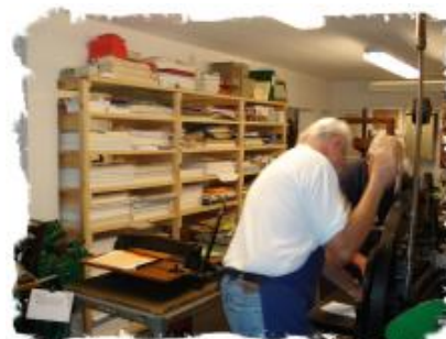
Bogbinderiet. På de gamle maskiner bliver der repareret bøger, lavet notesblokke. Og endvidere bliver alt papir til trykkeriet skåret her.